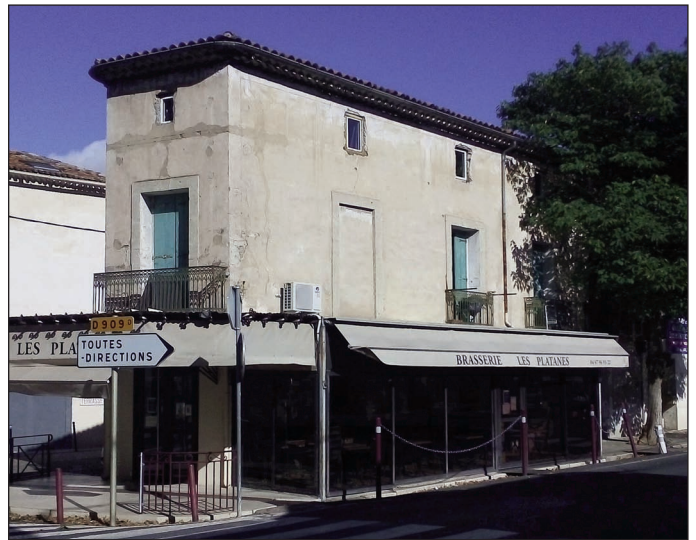
Fig. 3 : Le Café des Platanes

teau de Larcade, près de Canet , lieu de ralliement prévu, où il retrouve Jacky avec DEMARNE.