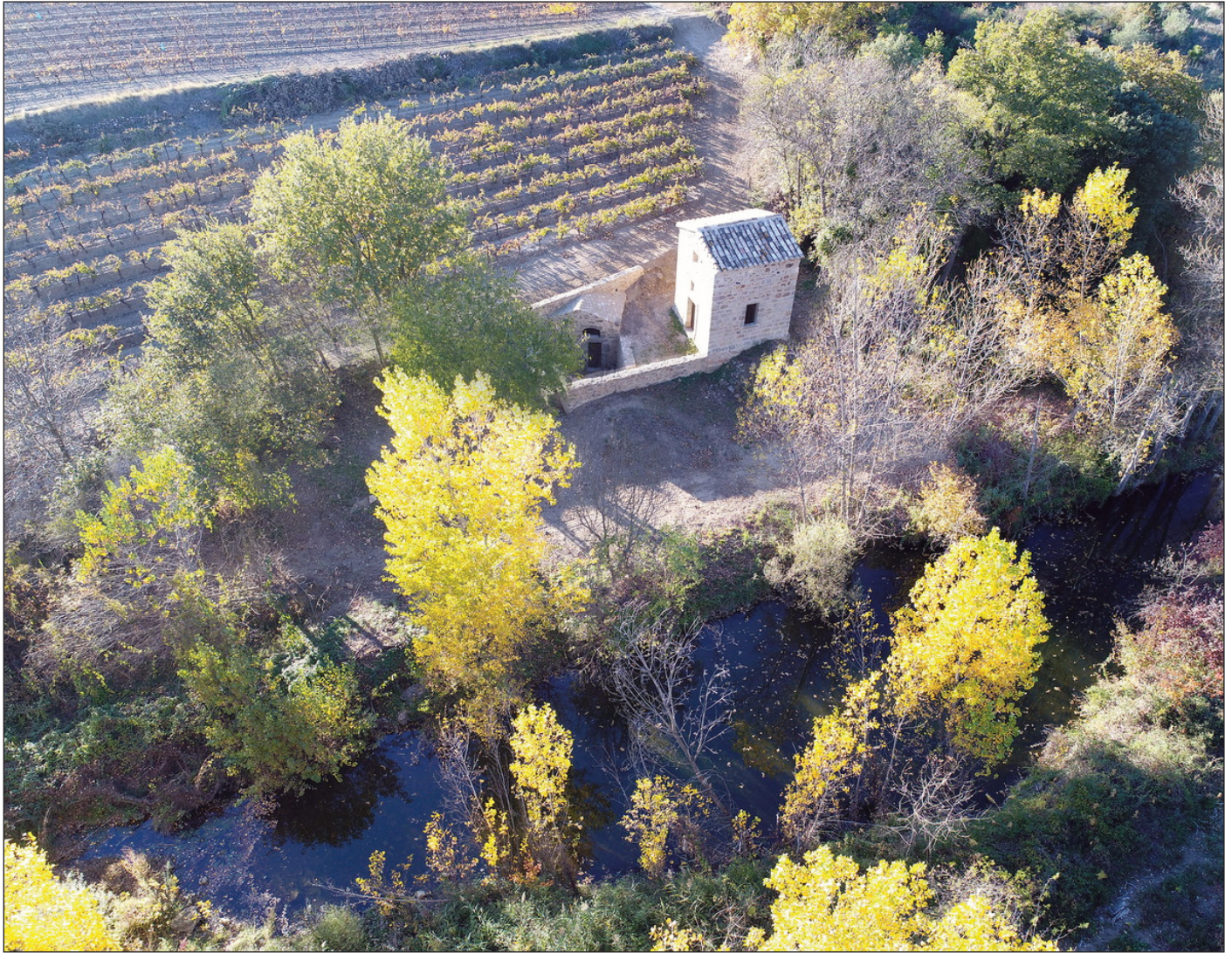
2. La Font de l'Oli en novembre 2017, après la seconde campagne de restauration

docteur BOUILLET en 1752. En dépit des efforts de l'évêque, la Font de l'Oli ne cessera de faiblir jusqu'à son tarissement définitif vers la fin du XIXe siècle alors que, par une série de forages à proximité de la source, l'on espère percer à jour le gisement. Les capsules Gardy « à l'huile de Gabian » sont alors confectionnées avec du pétrole brut de Pennsylvanie et de Virginie . Tout comme le sera le Gabianol au début du XXe siècle.