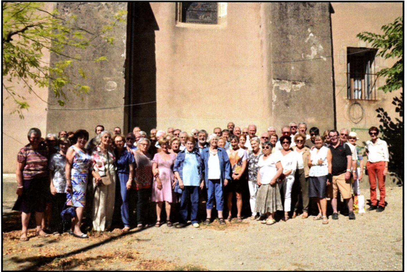
45 ème anniversaire

Bulletin du Groupe de Recherches et d'Etudes du Clermontais (Revue culturelle de la Moyenne Vallée de l'Hérault)