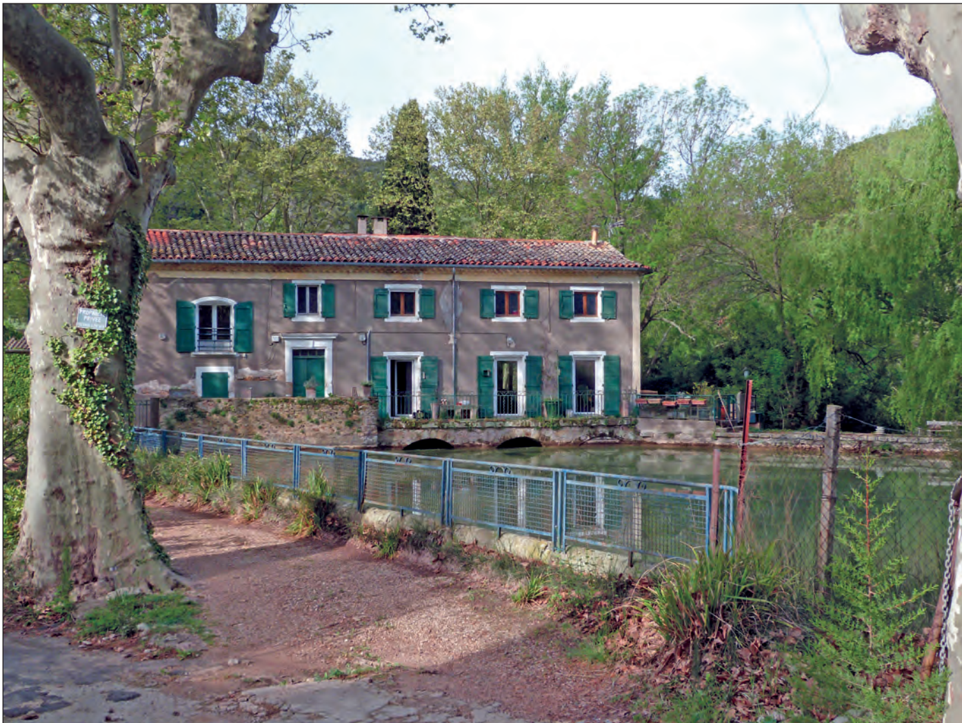
Le moulin aux cyprès en 2015

Le maire demande des secours pour les quinze familles atteintes, soit 45 personnes au total. Ces familles possèdent encore environ 2425 kg de farines empoisonnées. Le maire suggère même « ... le gouvernement ferait bien de s'en emparer tout en les payant parce que ceux qui les détiennent se trouvent sans ressources. »