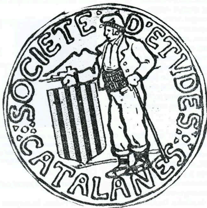
Logo de la Societat d'Estudis Catalans, dont Louis Pastre fut l'un des animateurs les plus actifs.