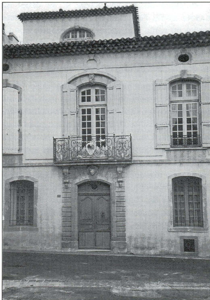
Façade de la maison cave à verdet, rue de la Dysse.