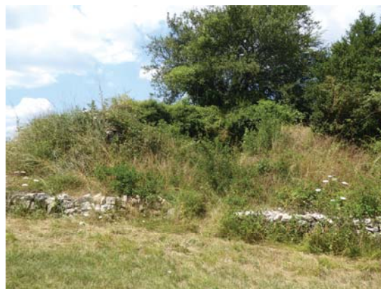
Glacière à Rogues.