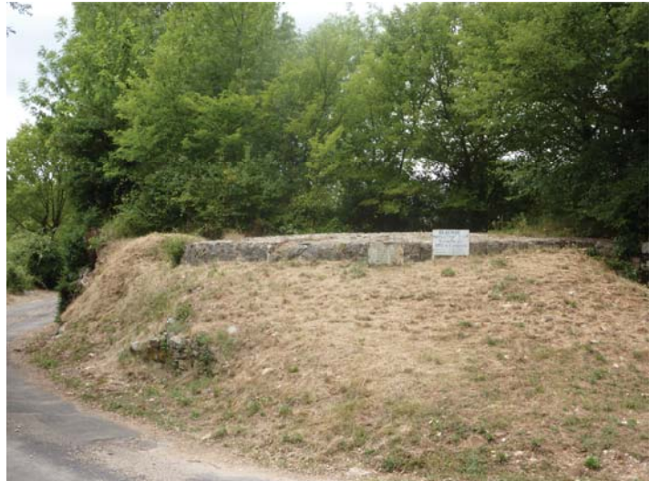
Glacière restaurée à Saint-Maurice-Navacelles (Hérault).

& qu'en conséquence, faute par lesdites Villes de faire la Consommation des Quantitez pour lesquelles elles auront fait leurs soumissions, les Maires et Consuls de chacune d'icelles, seront tenus de