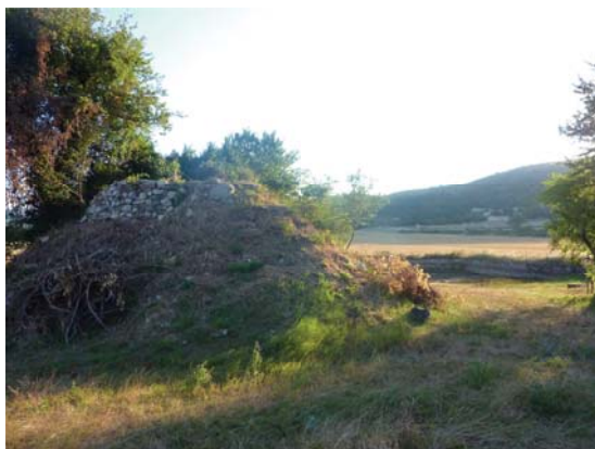
Glacière ruinée à Rogues près d'une lavogne.

Moyennant les dispositions énoncées dans cette transaction, il fut demandé aux propriétaires du privilège d'abandonner les charges portées contre la Province, le sénéchal de Montpellier et le Parlement de Toulouse. Toutes leurs demandes ou récriminations envers les communautés ou les villes devraient en outre être portées au conseil du roi.