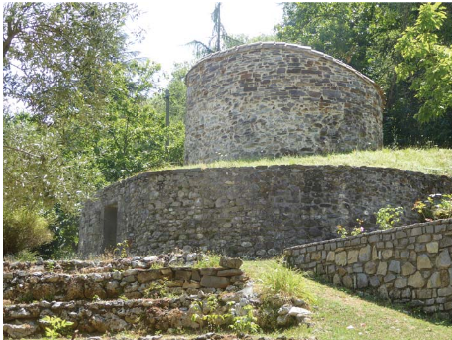
Glacière restaurée à Saint-Laurent-le-Minier.

Les propriétaires espèrent ainsi avoir montré leur impossibilité à renouveler leurs engagements dans les conditions précédentes. Ils s'en remettent au jugement des Etats pour leur fixer un prix raisonnable de la neige et un autre tout aussi juste pour la glace lorsqu'il gèlera suffisamment afin de leur permettre de reprendre leurs engagements pour vingt nouvelles année à partir du 21 janvier 1737. Ils sont d'autant plus confiants que les termes de la transaction envisagent une augmentation qui peut être celle des dépenses journalières. Alors, les Supplians continueront de faire des Voueyx pour la Conservation de leurs illustres personnes.