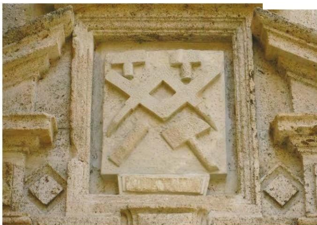
218, rue Jean Jaurès – Les symboles des compagnons.

NEZIGAN-L'EVEQUE. Dans le canton de Pézenas, le village fut résidence des évêques d'Agde. Il nous a donné onze dates, mais il renferme quelques rares curiosités à signaler.