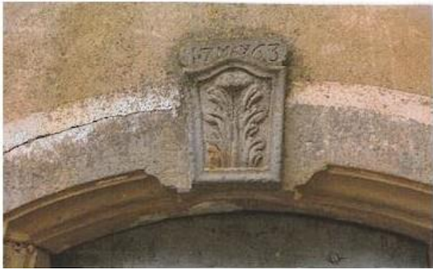
Montouliers - Maison datée du 17 may 63.

Dans le bas du village, une fontaine d'origine romaine for le seul point d'eau approvisionnant le village pendant des siècles. Elle est située au bas de falaises rocheuses où se trouvent des grottes à habitats préhistoriques.