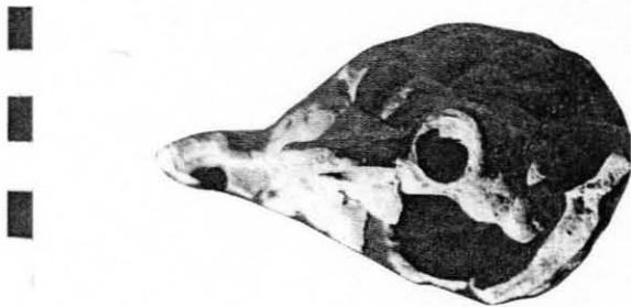
Fig. 1 — Lampe de Gourguilla

C'est dans ce contexte qu'elle a été découverte. Elle possède un bec, une anse à sa partie supérieure, et un trou de remplissage à l'arrière. Trois protubérances en partie inférieure permettent