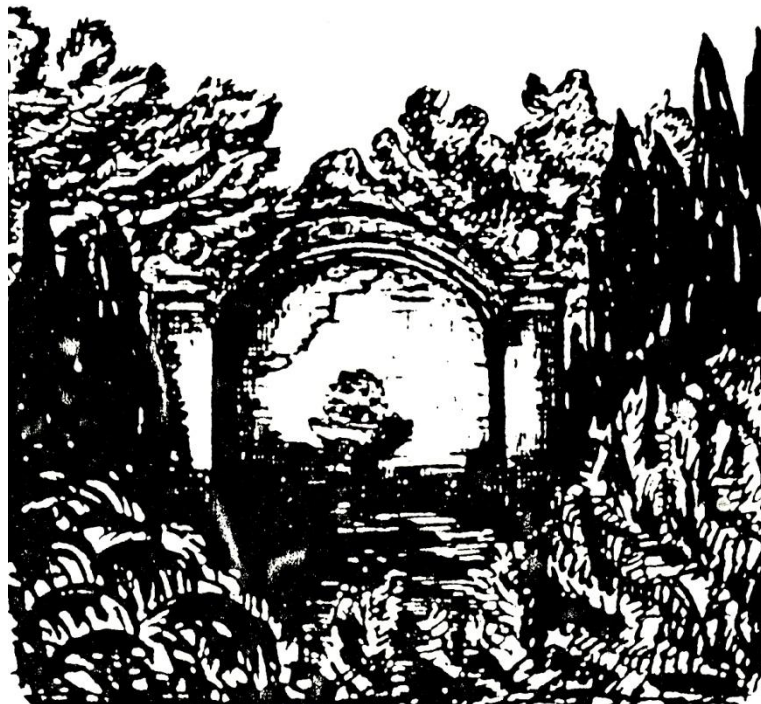
Buffet d'eau dit « Le Grand Guillaume »