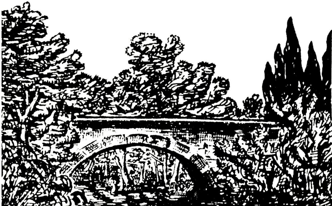
Pont de l'Amour