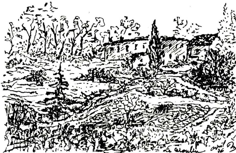
Le Moulin Bas