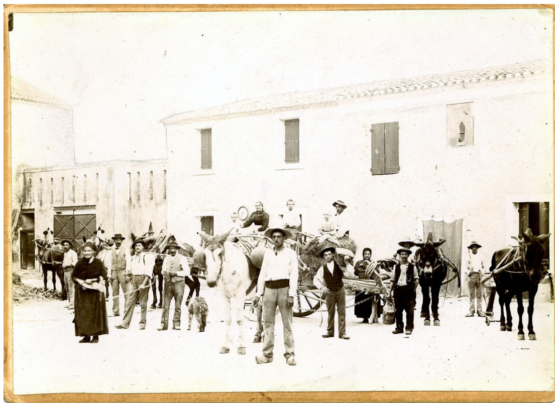
Fig. 72 - Le personnel du château dans la cour de la ferme (années 1890).