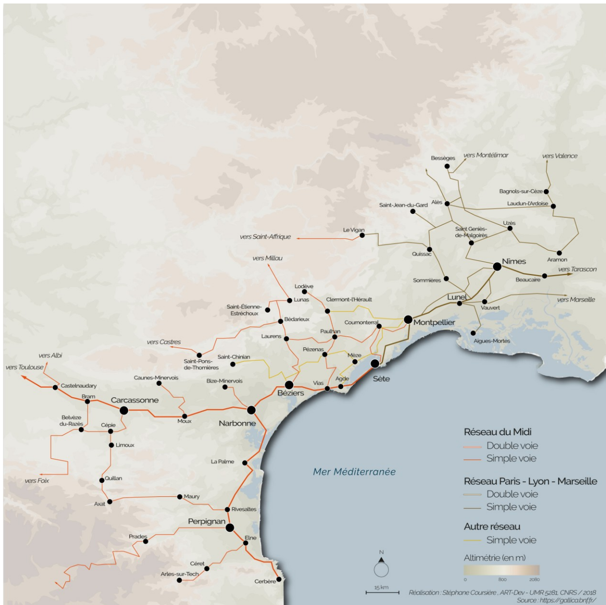
Fig. 5 – Le réseau ferré au XIX e siècle en Languedoc et Roussillon. © Stéphane COURSIÈRE et Llewella MALÉFANT.

Au XVIII e siècle, la carte de France de Cassini signale une redoute sur le site désert du futur Valras, et une chapelle dédiée à Saint-Martin-de-Valeras, plus éloignée dans les terres. Dès 1845, un groupe de baigneurs est remarqué, l'été. Quant aux pêcheurs, ils viennent camper le temps de leur saison de pêche qui s'étire du printemps à l'automne. La construction d'une route en 1854 reliant Béziers et Sérignan au bord de mer, favorise la fixation et le développement des deux pratiques qui vont demeurer duelles jusque dans l'emplacement de leurs constructions respectives. Dès 1856, à côté des cabanes de pêcheurs, cinq hôtels et des établissements de bains alignent leurs cabines de bois et de toiles en limite de rivage. La fréquentation du lieu est avant tout saisonnière et la présence à l'année peu nombreuse : 21 personnes en 1851, 74 en 1856 12 .