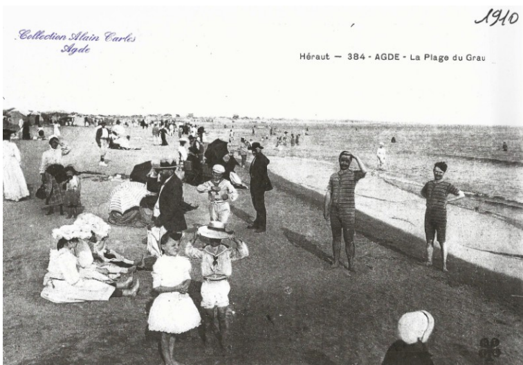
Fig. 4 – Les bains de mer au Grau d'Agde en 1910.

instant de détente et de bien-être. Aux regroupements sporadiques des premiers temps succède une présence saisonnière favorisée par l'occupation d'abris de fortune, souvent des cabanes de roseaux ou de planches, que se partagent pêcheurs et estivants. Certains lieux intéressent entrepreneurs et hommes d'affaires qui y créent des stations balnéaires : Balaruc-les-Bains (station thermale), le Grau-d'Agde, Palavas-les-Flots, Valras-Plage ; la ville de Sète, de par son ancienneté, est un cas particulier. Les plages de Carnon, de Maguelone, de Frontignan, de Mèze, de Marseillan et d'autres lieux, si elles offrent leur étendue aux baignades spontanées, mettent plus de temps pour agréger un noyau de vie permanent et attirer les investisseurs. (Fig. 3 et 4)