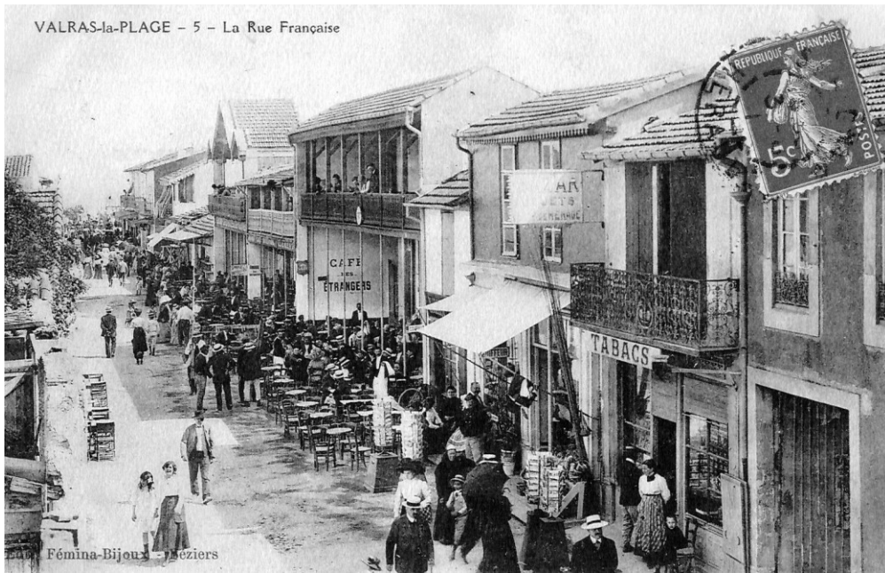
Fig. 7 – Valras : la rue commerçante vers 1910. (Coll. particulière).