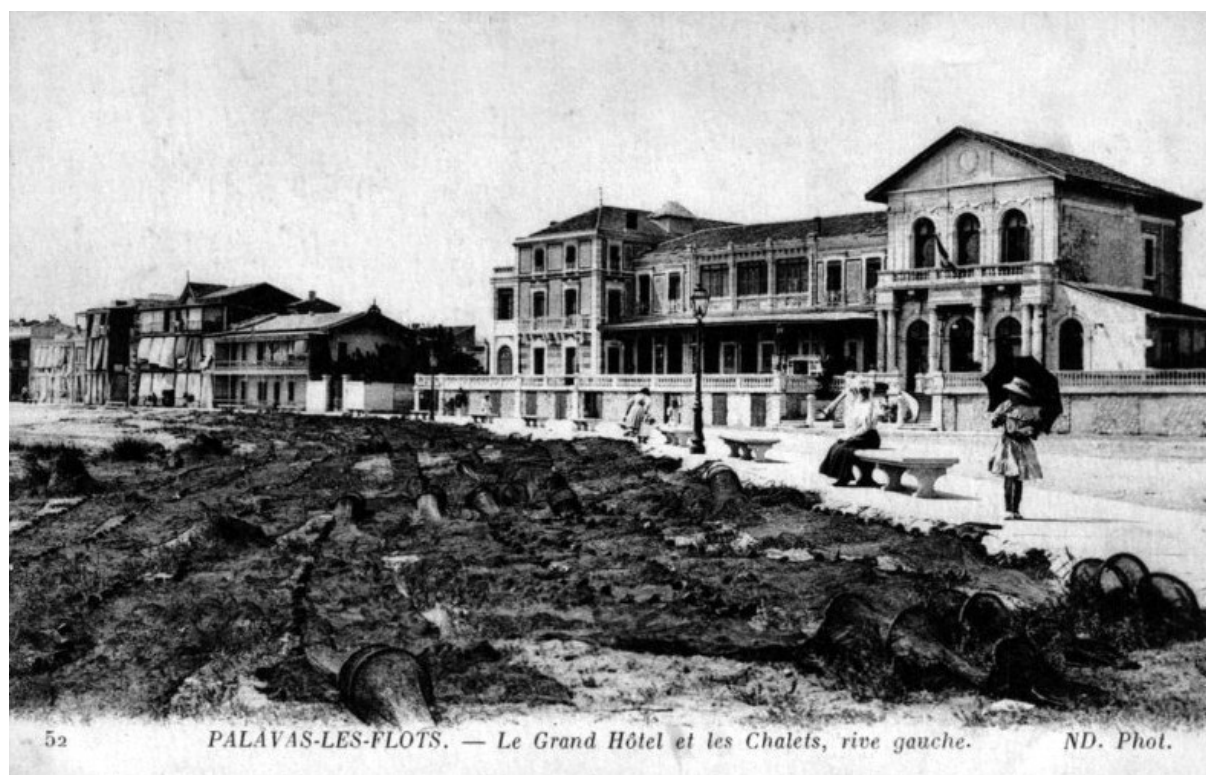
Fig. 6 – Le Grand Hôtel de Palavas-les-Flots.

Valras, qui est créée en 1931 aux dépens de la commune de Sérignan, ne bénéficie d'aucune ligne de chemin de fer. Envisagée en 1865, la liaison Béziers-la-Mer n'est pas créée. Dix ans plus tard, une ligne par tramway est projetée, qui utiliserait le procédé, inventé en 1853 par Alphonse Loubat. Il consiste dans la mise en place sur route d'un rail plat avec gorge. La ligne est inaugurée le 26 juillet 1879 et possède des rames composées de deux voiturettes tractées par une motrice à vapeur. Suite à des difficultés d'exploitation, le trafic est interrompu en 1881. Sa réouverture en 1883 consacre le retour à la traction animale. Ce tramway hippomobile demeure en service jusqu'en 1901. Le 16 septembre de cette année-là, des motrices électriques entrent en fonction. Comme celui du grau d'Agde, le tourisme valrasien est très populaire. Le développement de la station ne profite pas des capitaux qui sont investis plus généreusement à Palavas où la Société anonyme des bains de mer de Palavas , créée en mai 1873, a pour objet l'acquisition de terrains sur la plage, la construction et l'exploitation d'un établissement de bains de mer, d'un casino et d'autres équipements 13 . La même année, avec l'aide de Barbeyrac, comte de Saint-Maurice, propriétaire de la quasi-totalité des plages et des étangs de la rive gauche, cette société se lance dans la construction du Grand Hôtel des bains de Palavas sur 3 000 mètres 2 proches de la gare et de l'établissement des bains sur la plage.