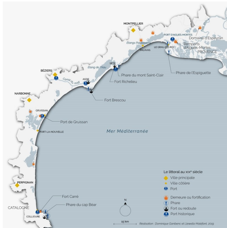
Fig. 1 – Forts, redoutes, phares et ports au XIX e siècle. © Llewella Maléfant et Dominique Ganibenc.