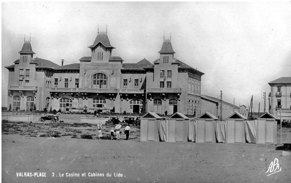
Fig. 8 – Valras vers 1930 : le Casino et les cabines de bains. (Coll. particulière).