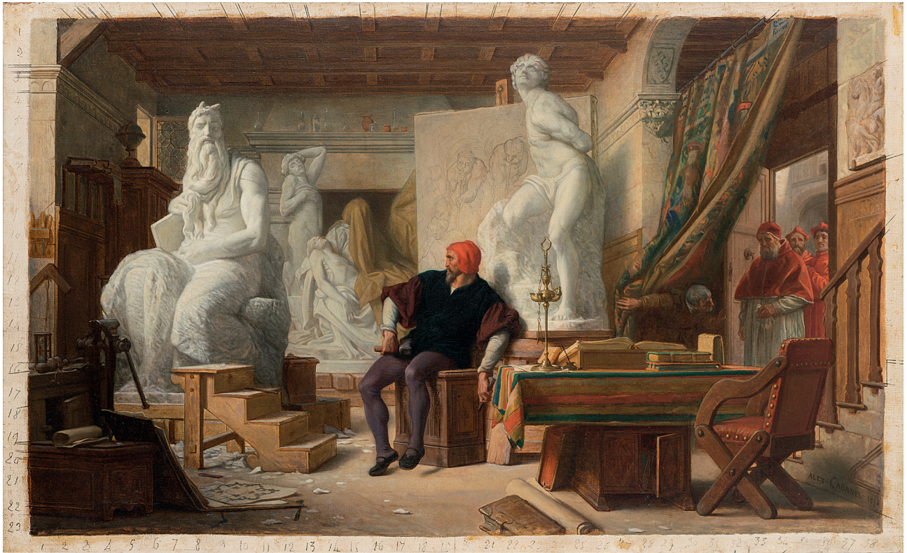
Fig. 1. Alexandre Cabanel, Michel-Ange dans son atelier visité par Jules II, 185(6?), huile sur toile, 63 x 103 cm, Montpellier, musée Fabre, inv. 2015.10.1.