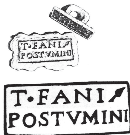
Fig. 4 - Le sceau de T. Fanius Postuminus (d'après l'article de M. Feugère et St. Mauné)

Mais il existe un autre document archéologique à rattacher à ce groupe familial. Il s'agit d'un sceau ( sigillum ), apparu sur la commune de Prades-sur-Vernazobre, qui se trouve à proximité de Saint-Chinian et qui jouxte Cessenon, Cazedarnes, Pierrerue et Berlou 31 . On lit dans un cartouche : T•FANI• / POSTVMINI ( fig. 4 ). Le texte marqué, qui