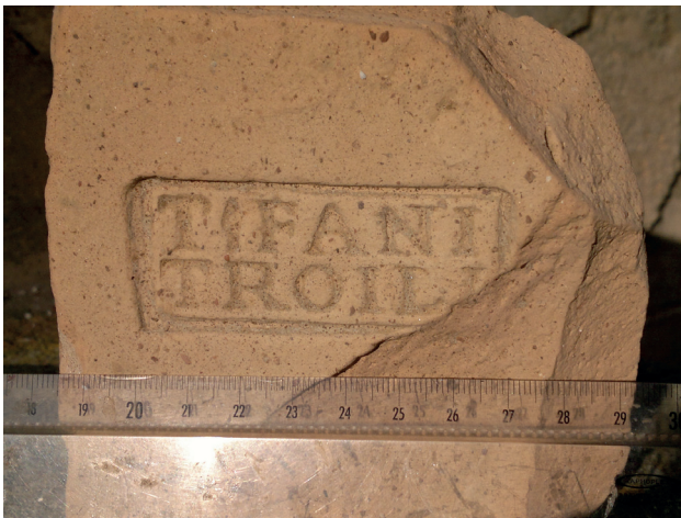
Fig. 1 - La tuile de la collection de la SA Béziers.

Dans les collections de la société archéologique de Béziers se trouve un fragment de tuile portant une marque de fabrication, dont les lettres avaient été inscrites en creux dans un cartouche de forme rectangulaire (7,1 x 2,7 cm), le tout ayant été imprimé dans la pâte avant la cuisson (fig. 1).