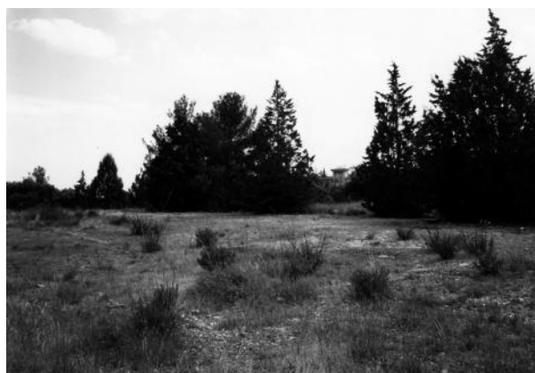
Fig. 7 - Plateforme où se trouvaient les baraques de logement.

En 1942, l'E.R.C.L. occupe pleinement le domaine des Quatre-Seigneurs. Il comprend, outre l'aide du château réservée à l'École, tout le bâtiment dit « des Hindous », neuf baraques réservées aux élèves, cinq baraques pour l'Éducation technique et ses machines outils, deux baraques de chefs et un stade « de dimensions modestes ». Les élèves épris de bains ne disposent que de la piscine d'une villa voisine ; des ...►