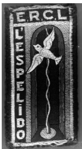
Fig. 5 - Fanion de l'École Régionale des Cadres du Languedoc.