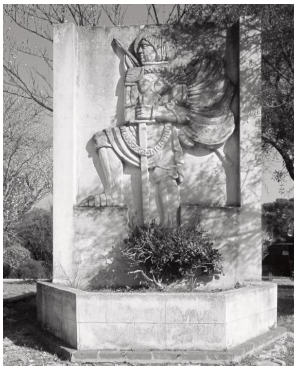
Fig. 11 - Sculpture du fronton de la chapelle.