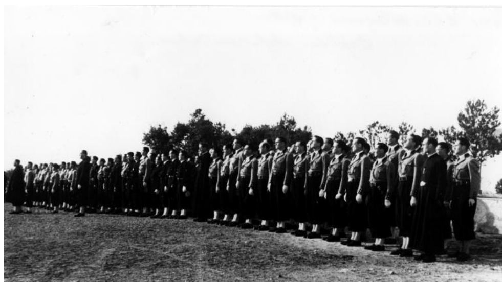
Fig. 6 - Cérémonie du salut aux couleurs à l'École régionale des Cadres, 1942.