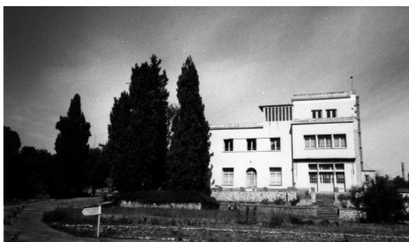
Fig. 2 - Le bâtiment des Hindous au château des Ecossais.

Sa tâche est immense, mais, malgré de lancinants rhumatismes, il ne manque ni d'enthousiasme, ni d'esprit d'initiative, ni de moyens. Il doit, rapidement, trouver à Montpellier un site adéquat où juxteront les services régionaux et les bâtiments de l'École régionale des cadres. Son choix se porte sur le château des Écossais. Cette curieuse bâtisse, qui fleure bon le romantisme des landes écossaises et où rode l'ombre de Walter Scott, a été construite, d'ailleurs, par un ...>