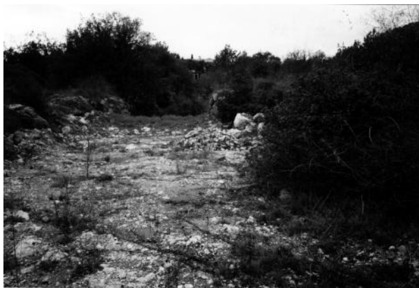
Fig. 8 - Emplacement de la piscine projetée en 1943.

... travaux inutiles ont été entrepris et poussés jusqu'en 1943 pour en tailler une dans le roc du domaine. On a pu longtemps en trouver des traces .Il y avait aussi une prison à deux places dissimulées dans les fondations du château.