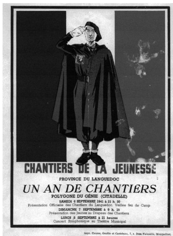
Fig. 4 - Affiche de l'anniversaire des Chantiers, Montpellier, septembre 1941.

Février 1941 visite de Lamirand, Secrétaire d'état à la jeunesse. Septembre 1941 la première fête régionale se déroule à Montpellier, sous forme d'un grand rallye, sous la présidence du commissaire Général de la Porte du Theil. Huit groupes de cent jeunes, venus à pied de tous les groupements de la Province, défilent dans les rues de Montpellier acclamés par la foule. Ils sont présentés au Drapeau des Chantiers qui avait été solennellement remis à Vichy quatre mois plutôt par le Maréchal Pétain au commissaire général. La veillée-feu de camp, au cours de laquelle est exécuté un grand jeu scénique, réunit des milliers de spectateurs au polygone du Génie. Cette fête marque l'apogée de la Province.