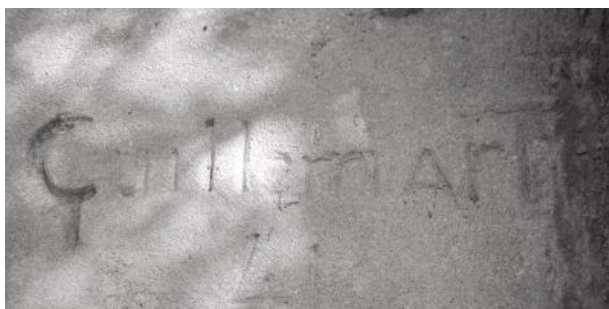
Fig. 9 - Signature du sculpteur R. Guillemart, 1941.

La chapelle est bénie le dimanche 25 janvier 1942, par l'évêque de Montpellier. Monseigneur fut accueilli par Monsieur l'abbé Jacquard, aumônier de l'École des Cadres qu'accompagnaient les chefs et les élèves. Avant la messe, Son Excellence répondit, félicitant et exaltant les vertus chrétiennes qui seules peuvent aider les jeunes chefs dans l'œuvre nationale à laquelle ils consacrent tous leurs efforts. Monseigneur Brunhes donna ensuite le certificat de ...>