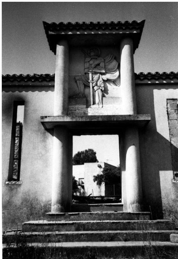
Fig. 10 - Façade de la chapelle construite en 1941-1942.