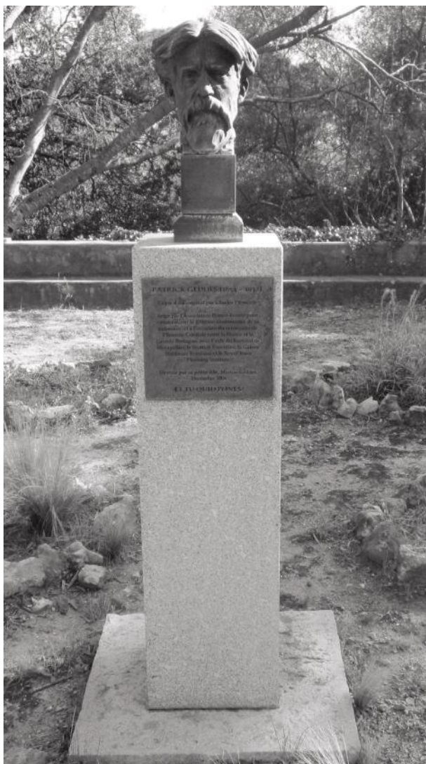
Fig. 3 - Buste et plaque commémorative de Patrick Geddes (1854-1932) au château des Écossais.

... écossais, Patrick Geddes (1854-1932). Après de brillantes études à l'Université de Dundee, ce touche à tout de génie « biologiste de formation, mais aussi urbaniste de passion et humaniste de raison » parcourt le vaste monde. Dès 1885, il a posé le pied à Montpellier et a eu un coup de foudre pour le Plan des Quatre-Seigneurs. Il y mourra en 1932. Mais entre temps, en 1920, il a créé une cité universitaire d'un genre nouveau.