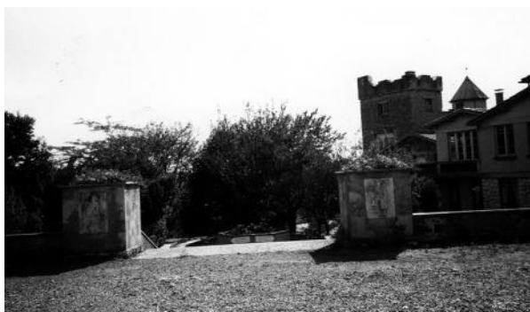
Fig. 1 - Le château des Écossais utilisé par les Chantiers de Jeunesse entre 1940 et 1943.