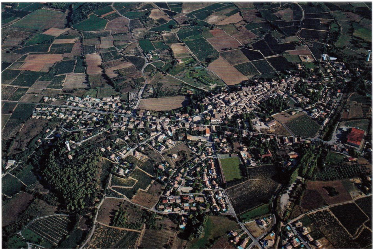
Fig. 1. Vue aérienne de Saint-Christol, au contact de la plaine et de la garrigue (SCoT).

cette région a baissé de 10%. Tout en réduisant son emprise, le vignoble languedocien a amorcé une restructuration en profondeur. Deux stratégies émergent : la première repose sur le regroupement de caves coopératives permettant à des vins de consommation courante des gains de productivité avec une orientation vers l'agro-alimentaire et la grande distribution ; la seconde, fortement identifiée à un territoire, vise à produire des vins à valeur ajoutée, ceux que l'on va choisir au caveau ou déguster dans les bars à vins. Le vignoble de Saint-Christol fort de son histoire, de son terroir et de ses traditions a opté pour cette seconde approche. Comment cette option y est-elle mise en oeuvre et vécue ? La tradition survit-elle à la modernité ? Les valeurs portées par des générations de vignerons sont-elles toujours