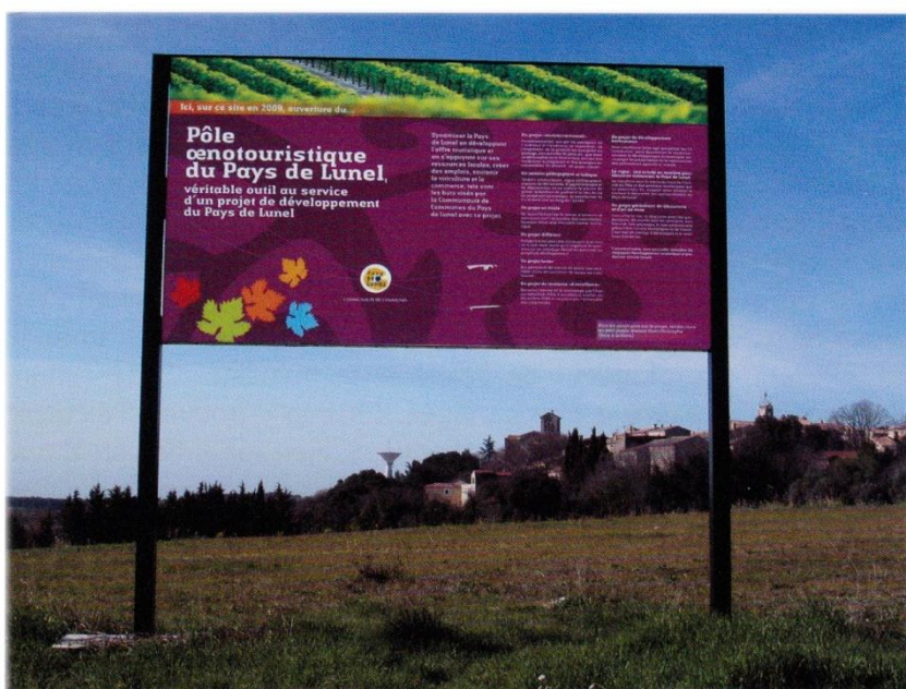
Fig. 5. Passé, présent, avenir : tout conjuguer au pôle œnotouristique de Saint-Christol (architecte Ph. Madec).

de Tourisme, par les communes, par le syndicat du cru Saint-Christol ainsi que par la coopérative et les domaines particuliers : fête des « Perles du Terroir », vendanges à l'ancienne, ballades vigneronnes, journées découverte d'un caveau et d'un domaine, journées d'initiation à la culture de la vigne pour les adultes ou avec les écoles, initiation à la dégustation... Mieux comprendre et partager la culture de la vigne et du vin, tant dans le passé que de nos jours, tel est l'objet de cet effort de valorisation dans une société où les valeurs rurales se trouvent marginalisées ou incomprises. Cette entreprise s'est particulièrement développée au cours des dernières années au moyen d'ex-