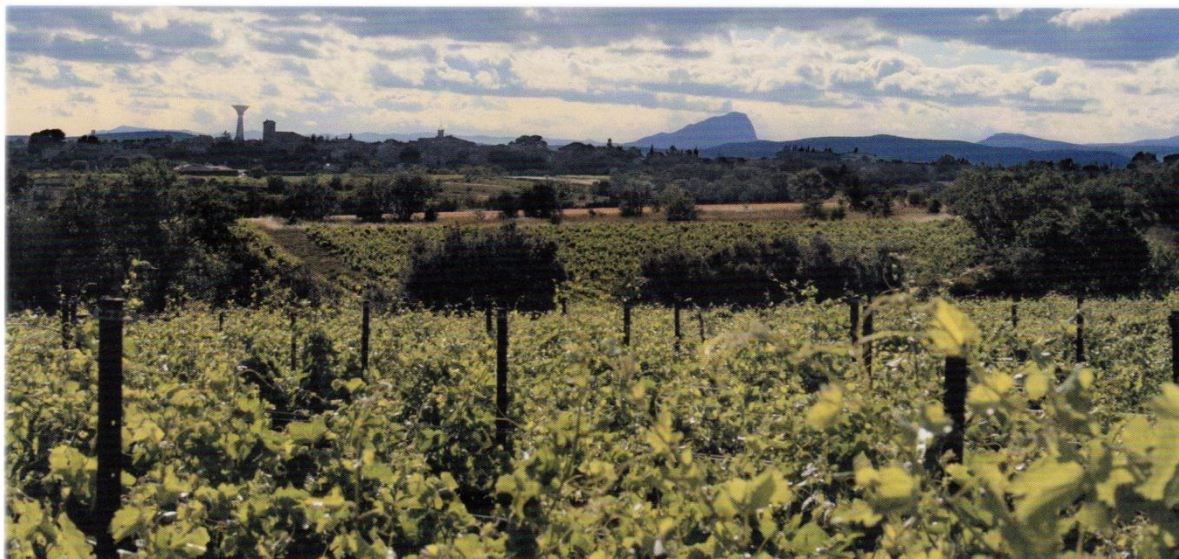
Fig. 2. Le village au cœur du vignoble, avec pour toile de fond le Pic Saint-Loup.

d'actualité ? La dimension patrimoniale culturelle de ce vignoble est-elle suffisamment médiatisée (fig. 2) ?