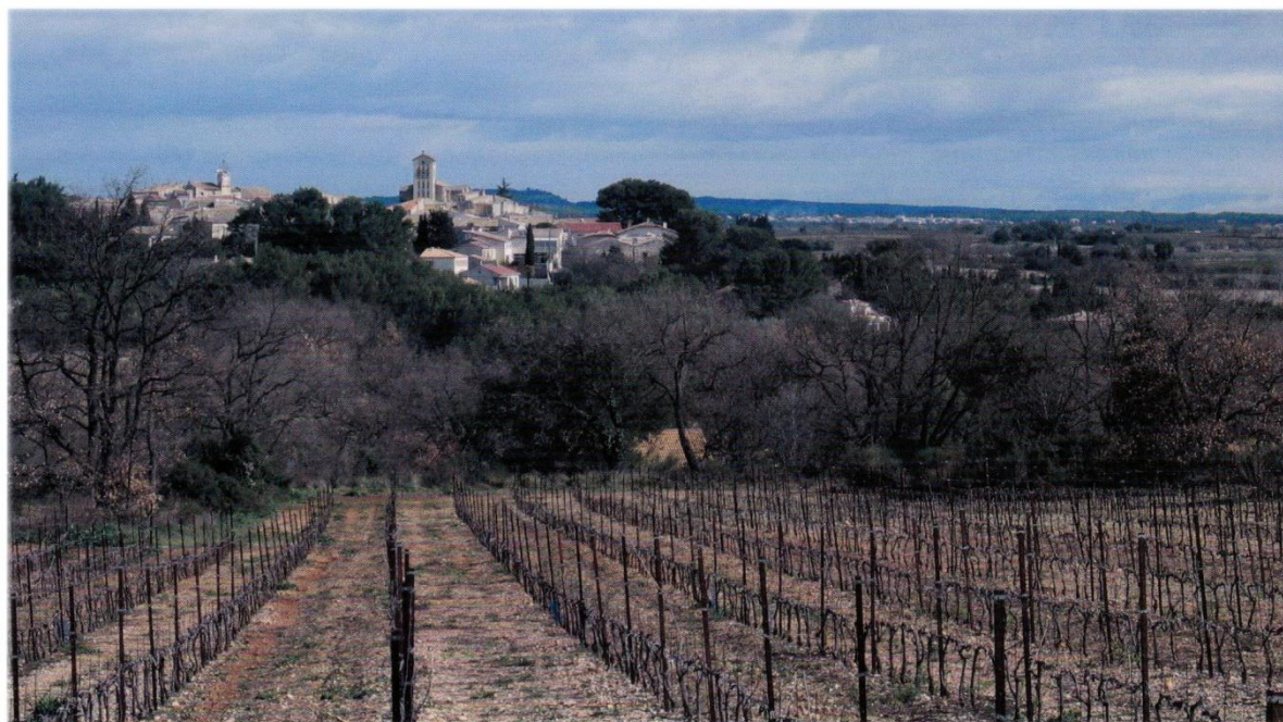
Fig. 3. Le vignoble en hiver avec son environnement de haies végétales préservées.

dition tout en bénéficiant des avancées de la modernité. C'est au sein de la cave coopérative, construite à partir de 1941, que se concentrèrent ces contradictions. Les forces vives du village surent mettre en place les solidarités nécessaires dans le cadre de la coopération et mobiliser les adhérents, plus de 200 dans les années 1960, sur des objectifs à long terme. Les vignerons du village avaient pu observer la montée du mouvement coopératif chez leurs proches voisins.