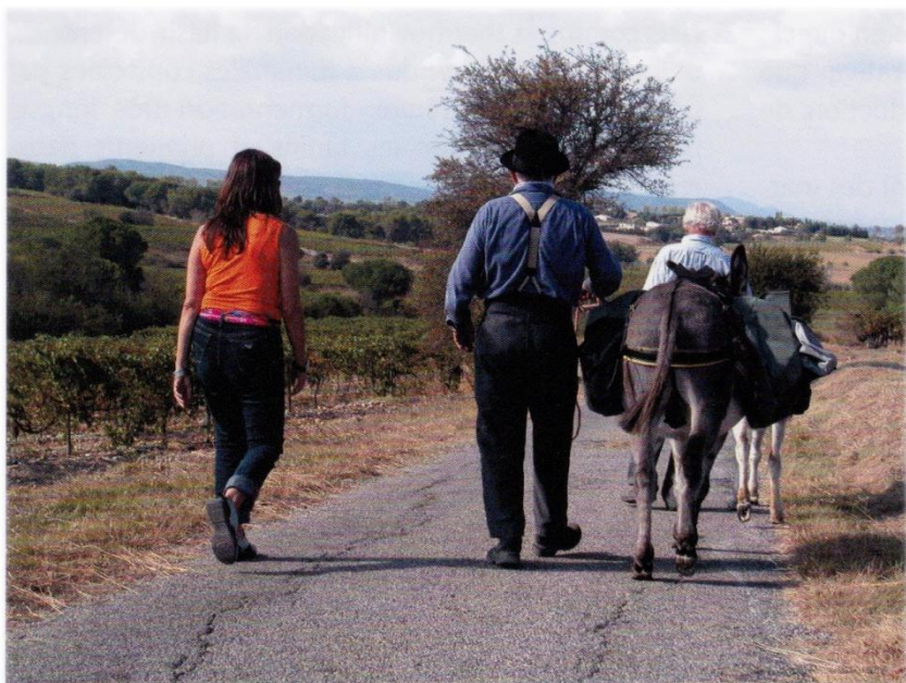
Fig. 4. Pérenniser le terroir, valoriser la viticulture, développer le tourisme vert (cliché Cl. Raynaud).