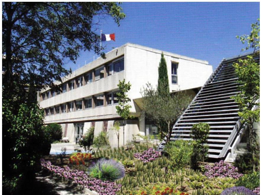
Direction Régionale de la Jeunesse, des Sports et de la Cohésion Sociale.

▪ Une politique éducative territoriale très structurée, à partir des Contrats d'Aménagement des Temps de l'Enfant (CATE), succédant aux Contrats Bleus, puis des contrats d'Aménagement des Rythmes de Vie de l'enfant et du jeune (ARVEJ), contrats de Ville Enfants Jeunes, signés avec les communes et offrant une multitude d'initiations aux activités sportives ou culturelles à des dizaines de milliers d'enfants et d'adolescents.