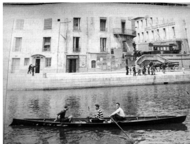
Fig. 5 - Aviron à Sète, vers 1901