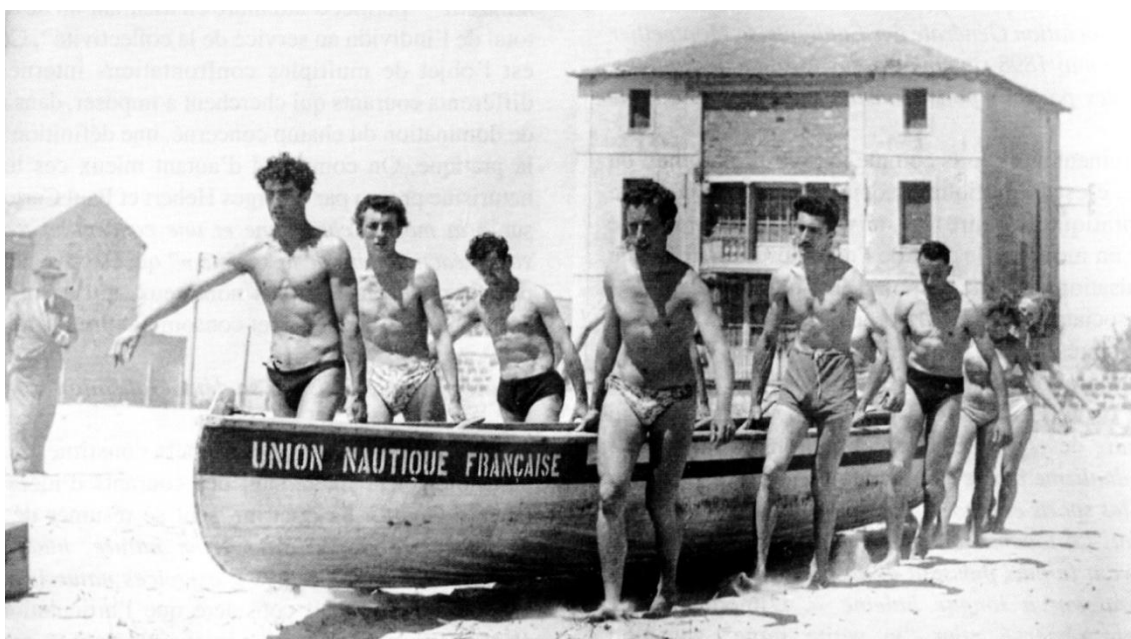
Fig. 6 - Transport d'un canoë, 1949.