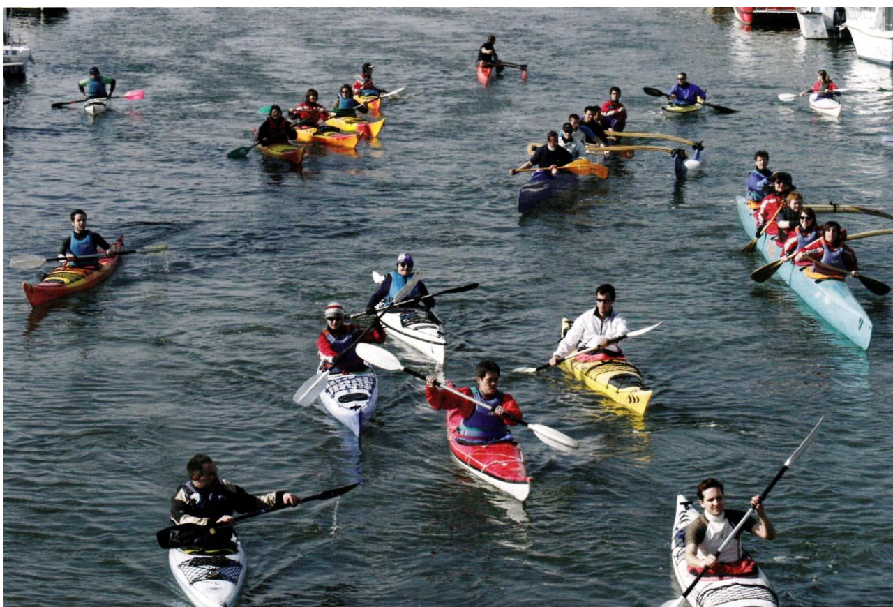
Fig. 10 - Floraison de couleurs : les sports de nature développent leur visibilité sociale en milieu naturel et... urbain - 2005.