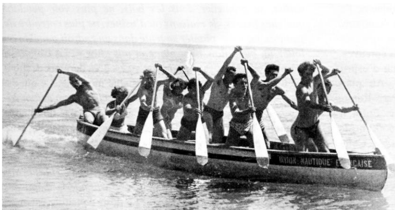
Fig. 7 - Canoëistes en action, 1949.

... rudimentaires sont disponibles à proximité. Un grand canoë canadien permet d'initier à la technique de la pagaie une dizaine de stagiaires à la fois. Il y a aussi des kayaks mono et biplaces 92 . L'activité se déroule sous la forme de randonnées le long du littoral, en direction de la plage de Maguelone. C'est en collaboration étroite avec l'Union Nautique Française 93 que cette annexe du CREPS est équipée du matériel technique nécessaire. Le CREPS a également utilisé, sur l'espace maritime, un cotre 94 nommé L'élan pour l'initiation à la navigation à voile. Mais une contrainte technique oblige l'établissement à se séparer rapidement de ce magnifique outil pédagogique car « il ne peut plus être utilisé à Palavas en raison de l'ensablement du canal » 95 .