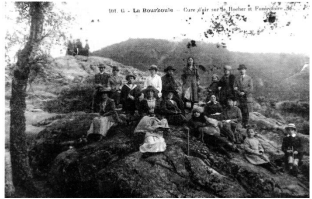
Fig. 2 - Cure d'air à la Bourboule vers 1919.

... de mise en relation de l'individu avec le milieu naturel. Il est prétexte à un " retour symbolique aux origines ". Il offre cette symbiose avec la mère nature et s'affiche idéalement dans l'image du corps dénudé offert aux éléments naturels. C'est ce que souligne le Dr Louis Pathault lorsqu'il écrit dans une revue médicale le texte suivant :