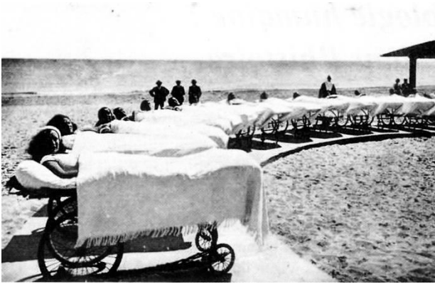
Fig. 1 - Héliothérapie à Palavas, début XX e siècle. Musée du patrimoine « Jean-Aristide Rudel » à Palavas-les-Flots. Remerciements à Monsieur Bruno Gutierrez.