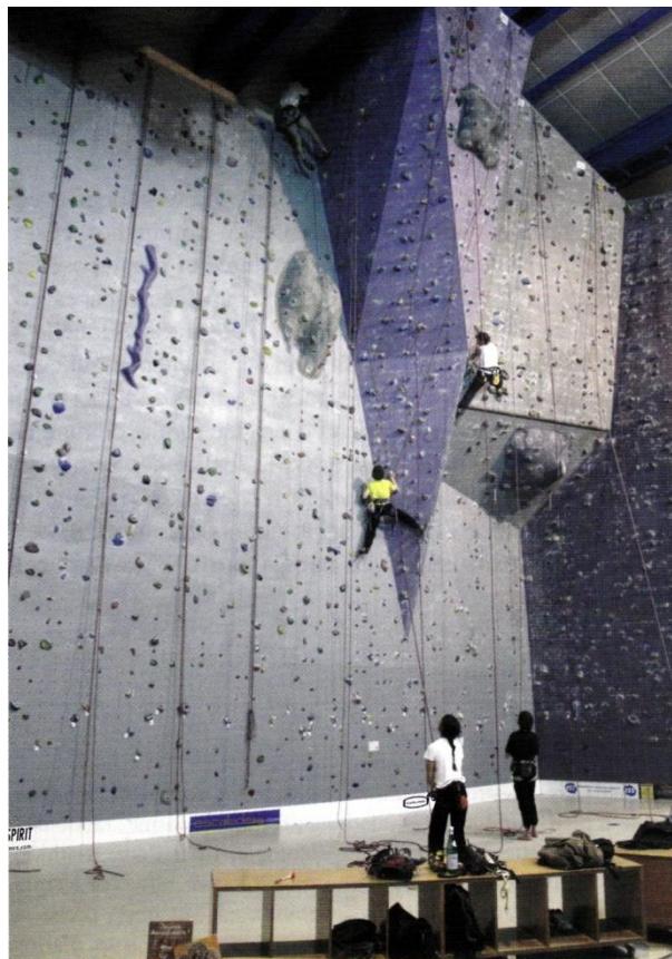
Fig. 9 - Salle d'escalade artificielle à Grabels, avril 2010.

Guy Haye 154 envisage ces mutations dès 1978, car, dit-il : « la compétition est un des aspects du plein air dont le seul défaut serait de faire oublier les formes non normalisées de sa pratique ». Pour cet auteur « tous les modes de pratique s'enchevêtrent continûment. Tous sont nécessaires ». Le plein air hors compétition pose des problèmes qui sont à régler d'abord par les pouvoirs publics : réservations foncières, application des textes portant sur la pollution, restriction des dérogations à construire, infrastructures routières, continuité des itinéraires de randonnée, etc. Il termine sur le constat de deux mondes différents « l'un fortement institutionnalisé et contraignant, l'autre rempli de libertés individuelles dont il faut être si respectueux que la non intervention est de règle ». Aujourd'hui, ce sont les libertés individuelles qui interrogent la pérennité d'une nature disparaissant sous des enjeux économiques qui la réduisent à un simple discours !