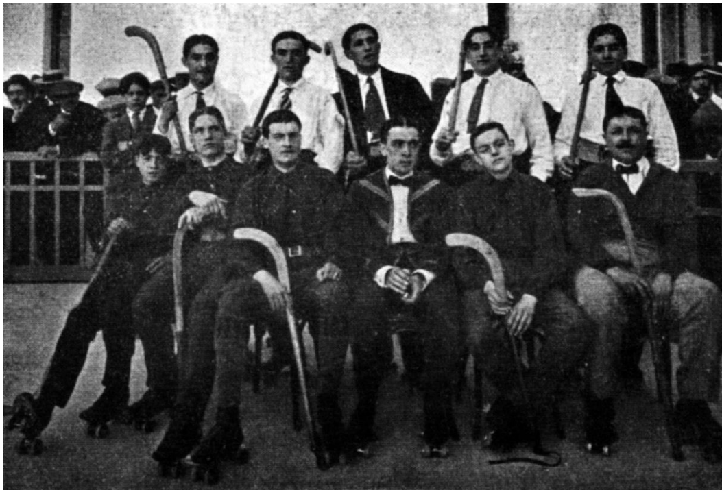
L'équipe du Hockey Club Perpignanais, saison 1914.