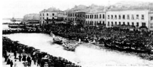
Fig. 4 - Vue d'ensemble des joutes de la Saint Louis au début du XX ème siècle. Carte postale édition Cettoise 1910.

innovants : Le Pavois d'Or , disputé selon la méthode languedocienne par les meilleurs jouteurs de France qu'ils soient Parisiens, Provençaux, Givordins, etc. et la Coupe d'Or , un tournoi-défi qui oppose une équipe de trente jouteurs sétois montée sur une barque, à une autre composée de trente régionaux. Ce Prix comprend deux épreuves le " Prix de la barque " et le titre de " Champion de la Coupe ".