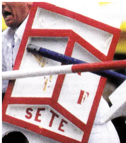
Fig. 6 - Pavois de combat.

En 1978 l'ancienne décoration en entrelacs des lances de 2,80 m sur 3,6 cm de diamètre s'est subdivisée en trois parties la première de couleur bleue ou rouge mesure 1 m. C'est la partie obligatoire pour le maintien de la lance suivent deux zones interdites : la première garde longue de 1,10 m en blanc et la deuxième garde de 0,70 m, le jury sanctionnant la faute par des observations, avertissements et même disqualification en cas de récidive.