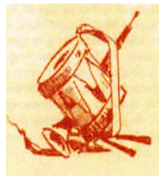
Fig. 1 - Tambour et haubois de joutes. Histoire des joutes cettoises, Toussaint Roussy, Sète, 1905.

Le jouteur, en bleu-azur pour les célibataires et en rouge-vert 8 pour les hommes d'âge plus mûr, est équipé d'une lance (2,73 m de longueur, 13,5 cm de diamètre à la poignée) munie d'une couronne de fer 9 de 10,08 cm à son extrémité, et d'un long pavois (81,8 cm de longueur, 43,2 cm de largeur, 2,5 cm d'épaisseur). Il se tient droit, les pieds joints serrés sur une étroite planche fixée horizontalement sur deux poutres surélevées ( les bigues ) qui prolongent l'arrière du bateau. Le coup qu'il doit donner se décompose en quatre temps :