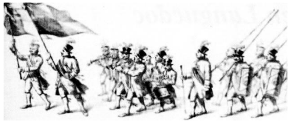
Fig. 2 - Défilé de la jeunesse et des mariés au XVIII ème siècle d'après un dessin de Toussaint Roussy. Histoire des joutes cettoises, Toussaint Roussy, Sète, 1905.

La joute languedocienne, de l'Ancien Régime au milieu du XIX e siècle, n'est pas sans rappeler quelques aspects du jeu provençal de cette même époque. A Marseille, à Cassis, le " targaire ", c'est-à-dire le jouteur, tout de blanc vêtu se tient droit sur une étroite planche fixée au bout d'une sorte d'échelle sans degré, arrimée à la poupe du bateau. Il porte à la main droite une lance terminée par un bouton ou une plaque, à la gauche un bouclier de bois 10 . Il s'agit encore, en Languedoc comme en Provence, de joutes d'équilibre dans lesquelles sont envoyés à l'eau non pas les jouteurs les moins forts, mais ceux dont la stabilité est la plus incertaine.