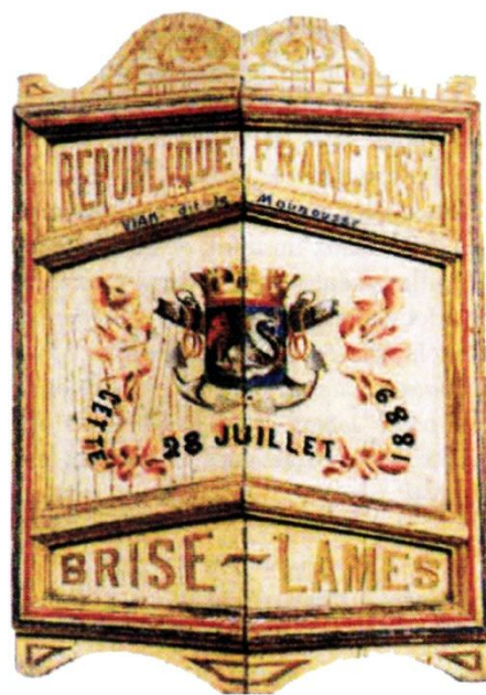
Fig. 3 - Pavois d'honneur - 1889. Service Communication de la ville de Sète.

L'activité économique du bas-Languedoc se faisant plus prospère, grâce notamment au développement de la viticulture, l'enrichissement général qui en découle profite aussi à partir de 1845 aux manifestations festives. Notamment à Sète, alors en plein essor, où le maire insiste sur son intention de faire exécuter comme chaque année des joutes sur l'eau car elles attirent toujours un grand nombre d'étrangers qui apportent un réel profit à la commune, ceci par le paiement des taxes de l'octroi qui gonflent les budgets attribués aux fêtes 15 . Prenant alors un sens touristique, les joutes se doivent de devenir plus attractives et se faire surtout plus dynamiques. Des évolutions techniques et des modifications d'ordre social apparaissent, et, accentuent définitivement l'originalité de la Joute languedocienne.