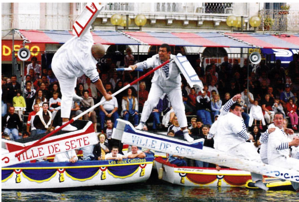
Fig. 7 - Une passe, catégorie poids lourds.

Alors en avant, les barques, toutes ! Mariés, tenez-vous bien, Voici la Jeunesse qui arrive.