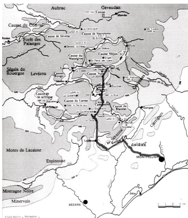
Fig. 2 - L'itinéraire du voyage de Marcel de Serres