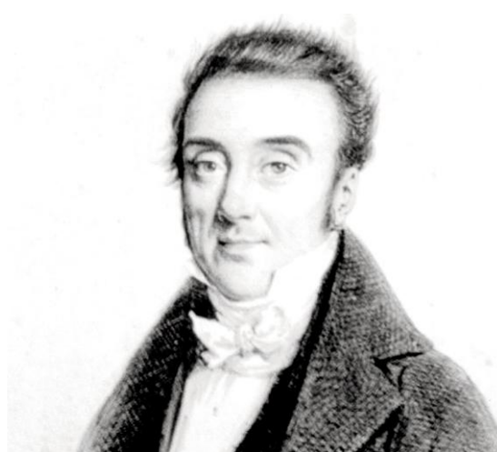
Fig. 3 - Portrait de Marcel de Serres

Cette lecture et cette rapide présentation du Journal de voyages de Marcel de Serres, laisse en définitive entrevoir une œuvre de grande portée. Bien évidemment, l'auteur est un homme cultivé, il était le fils d'un Président de la cour des