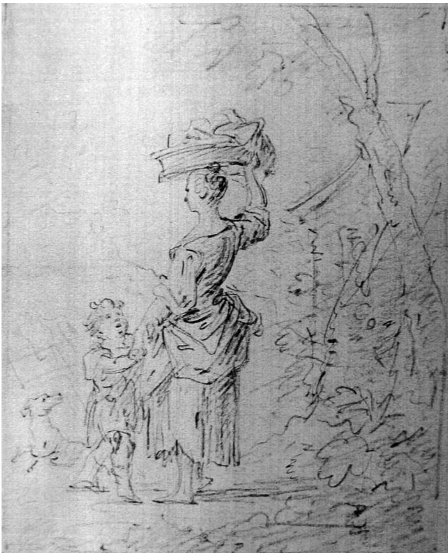
Femme au panier - Indiana University, USA

Au sein du corpus des oeuvres de Loys peuvent être dénombrées davantage de scènes mythologiques. Certaines sont attestées comme étant de sa main et sont exposées dans des musées ou entreposées dans leurs réserves. Deux d'entre elles ont été citées précédemment : il s'agit du Parnasse et du Tartare , projets de décors pour la Comédie. La troisième, David outragé par Séméï 57 , se trouve à l'Ecole des Beaux-Arts de Toulouse. Figurant un affrontement entre les deux personnages, la toile, en très mauvais état aujourd'hui, a reçu le Grand Prix Municipal de peinture