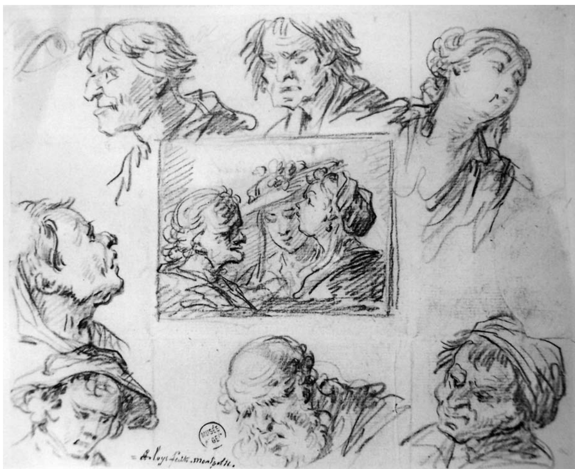
Dix têtes - Musée Atger, Montpellier - Copyright Service Photo BIU Montpellier

C'est sans doute ce qui explique la forte proportion d'études de visages et de parties du corps humain que l'on peut observer parmi les oeuvres de Loys qu'il a conservées : une étude de dix têtes de personnages féminins et masculins d'âges divers 46 , qui semble indiquer la prédilection de son auteur pour les nez forts et busqués, un portrait de vieille