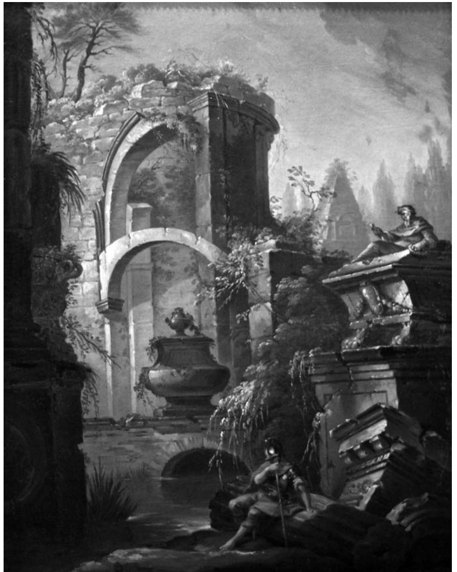
Soldat au pied de ruines - Musée des Beaux Arts, Béziers

A l'abbaye de Saint-Guilhem-le-Désert et dans la nef de l'église de Vendémian sont exposés trois tableaux faisant partie d'un même ensemble et mettant en scène la vie de Saint Guilhem 64 . Cette série d'œuvres a été exécutée à Montpellier entre 1750 et 1765. Bien qu'elles ne soient pas signées, elles ont été attribuées à Loys. D'après Léon Vinas 65 , ces trois peintures proviendraient, à l'origine, de l'abbaye de Gellone, à Saint-Guilhem-le-Désert. Lors des saisies révolutionnaires, elles auraient été entreposées dans un dépôt départemental situé à Lodève, puis deux d'entre elles auraient été transportées par erreur à Vendémian : « A la réouverture des églises, au commencement du siècle [XIX e ], deux habitants de Vendémian allèrent à Lodève