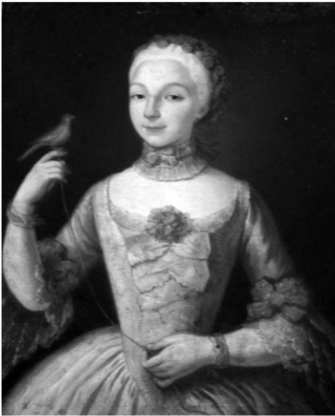
Portrait de Catherine de Barrès - Musée des Beaux Arts, Béziers

portraitiste qu'est Loys (il s'agit de l'activité du peintre la mieux documentée, mais aussi la plus critiquée !), certaines oeuvres lui sont attribuées de manière incertaine.