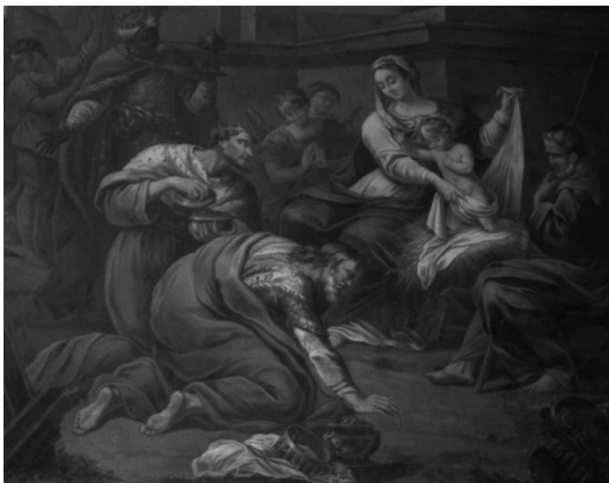
Adoration des mages - Eglise St Sauveur, Aniane -Copyright L. Vitaux

que l'on peut faire entre la soeur en bleu et saint Guilhem, l'un debout, les yeux au ciel, les mains écartées, dans une attitude d'attente et d'ouverture, et l'autre, agenouillée, le regard dans le vague et baissé, les mains repliées sur la poitrine dans une attitude de fermeture et de repli. L'intensité du moment est palpable. Au second plan, à gauche, apparaît un tabernacle, qui, en comparaison du soin apporté aux visages et habits des personnages, paraît d'une mauvaise facture. Le peintre a-t-il laissé à l'un de ses élèves le soin de finir le cadre de la scène ou s'agit-il d'un ajout postérieur ? La restauratrice a pu établir que la peinture du décor et celle des personnages sont contemporaines et que l'assurance avec laquelle a été peint le tabernacle, à grands coups de pinceau, sans aucune hésitation dans les traits, montre que l'auteur de l'objet possédait une grande maîtrise de son art. Si un élève avait peint ce décor, celui-ci aurait revêtu des traces de rupture : les traits auraient été courts, hésitants, le travail aurait progressé petit à petit. Ce manque d'intérêt porté à l'arrière plan de la scène s'explique par la volonté de l'artiste de ne pas le mettre en valeur : il importait qu'il s'efface presque, qu'on l'oublie, au profit des personnages.