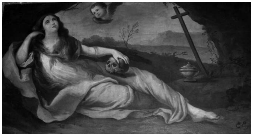
Sainte Madeleine en contemplation - Cathédrale St Nazaire, Béziers - Copyright L. Vitaux