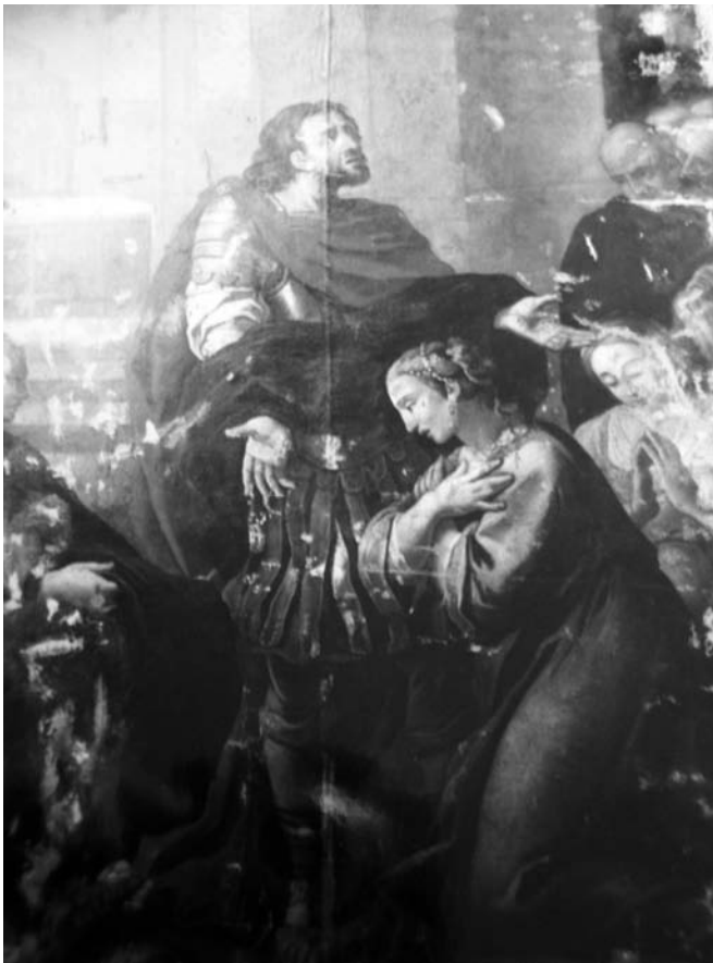
St Guilhem renonçant à la vie terrestre (avant restauration)

réclamer le tableau enlevé à leur église. On leur indiqua le galetas où on les avait entassés, après les avoir roulés. Leur choix fut bientôt fait, et au lieu d'un ils en prirent deux. Arrivés à Vendémian, ce ne furent pas les saints Marcellin et Pierre, leurs patrons, qu'ils avaient apportés, mais ces deux belles toiles ayant appartenu à l'église de Saint Guilhem. Il y en avait une troisième, qui prit le chemin de Pouzols, près Lodève ». Ainsi l'église de Vendémian a-t-elle hérité de la Mort de Saint Guilhem et de Saint Guilhem remettant la Vraie Croix . Quant à la troisième toile, Saint Guilhem renonçant à la vie terrestre , elle a été restaurée en 2005 et rendue à l'abbaye de Saint Guilhem.