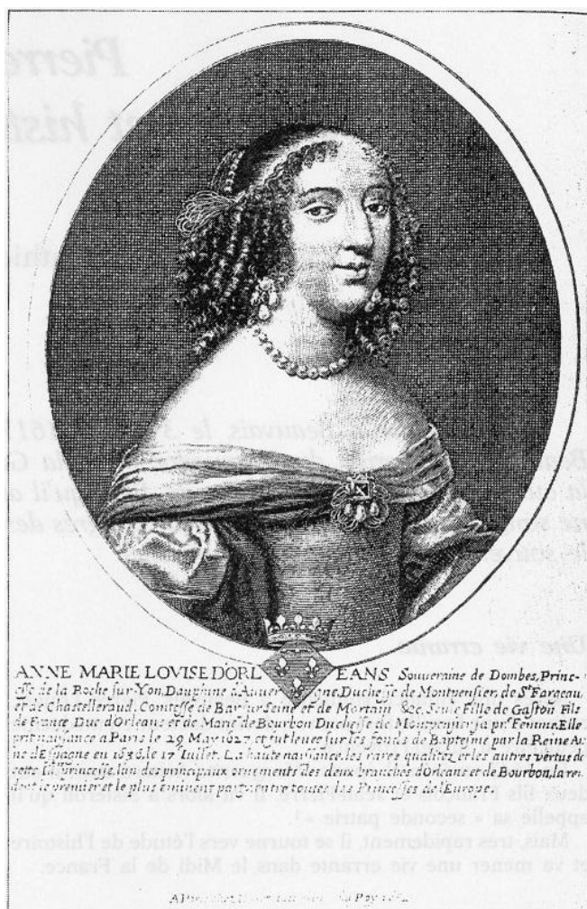
La Grande Mademoiselle dont Louvet était l'historiographe.

Comme on l'a vu après avoir classé les archives municipales de Montpellier, Pierre Louvet entreprit d'écrire l'histoire de la ville. Fondé sur les archives, le travail était solide comme on l'a vu plus haut, le manuscrit en est maintenant perdu 6 . Regrettons-le pour Louvet et pour Montpellier.