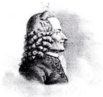
Portrait de Voltaire, E. Rioult, 1818.