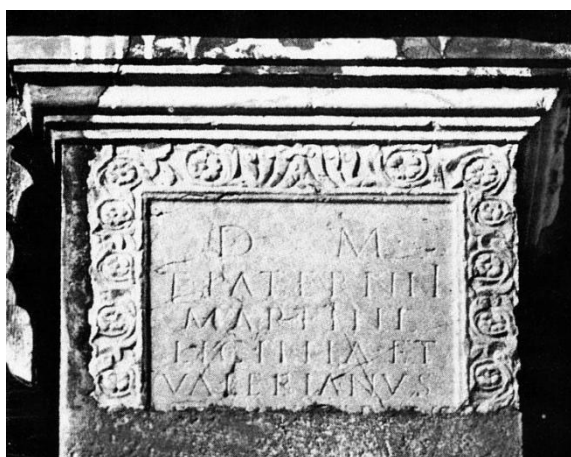
Fig. 2. - Inscription de Fabrègues (Hérault).

D M T PATERNII MARTINI LICINIA ET VALERIANVS