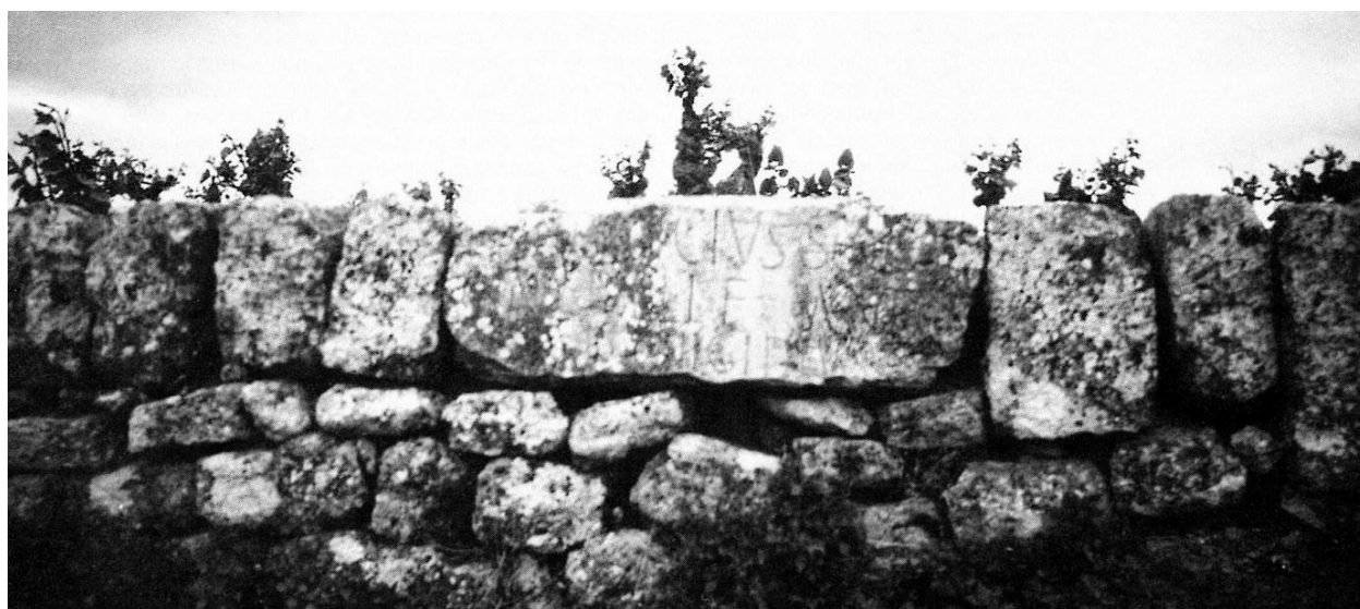
Fig. 1. - Inscription de Saint-Georges-d'Orques (Hérault) (cliché abbé Cl. Guichard, 1932). Cette inscription est réutilisée comme couronnement du mur de soutènement d'une parcelle de terre complantée en vigne. Il n'est pas possible de savoir si les moellons qui l'entourent appartenaient ou non à la pierre inscrite.

E. Espérandieu, dans sa lettre à l'abbé Guichard, estimait que l'on avait affaire à une longue inscription paraissant « provenir d'un linteau de porte de tombeau ». Il pensait que ce fragment ne contenait pas moins de quatre noms. On aurait eu, à la première