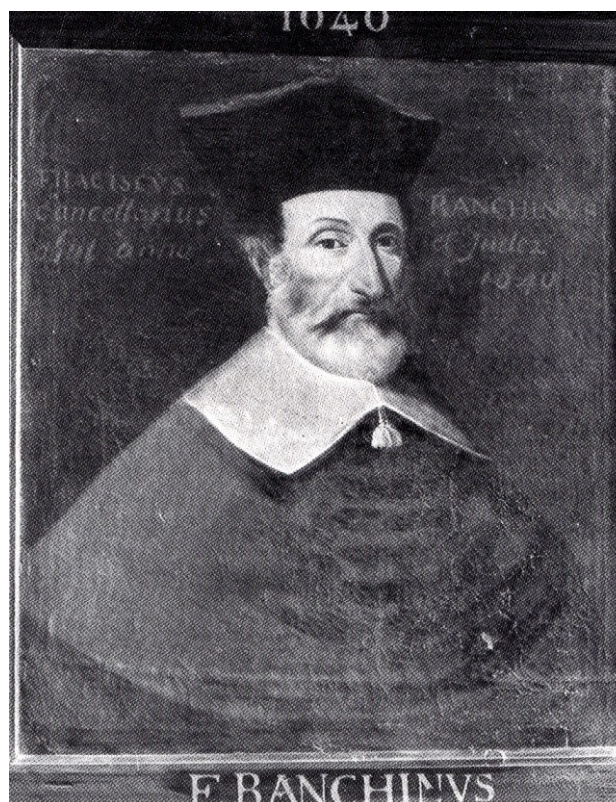
Fig. 1. - François de Ranchin, Faculté de Médecine, Montpellier (Photo : Descosy - © 1984 Inventaire Général S.P.A.D.E.M.).

Le cabinet Bornier ou Teillan, vendu en 1711, est l'oeuvre de trois générations de conseillers à la Cour des Comptes dont il est difficile de départager l'apport particulier : Simon de Bornier (1604-1648), son fils Pierre (1631-1668) et enfin son petit-fils Jacques Philippe (1662-1711) (6) . Mentionnée par Pierre Borel dès 1649, cette collection est décrite par un état datant de 1711 (cf. Annexe). Les seules antiquités qu'elle renferme « seize figures de bronze sur des pieds d'estau de bois représentant plusieurs animaux et figures des dieux des païens », sont des idoles égyptiennes que François-Xavier Bon réussit cette fois à s'approprier. D'autre part, les Bornier, dans le parc de leur château de Teillan situé près de Marsillargues à mi-chemin entre Nîmes et Montpellier, avaient rassemblé après 1665 six bornes milliaires. En effet, à cette date, les deux bornes les plus importantes de César Auguste étaient encore signalées à leur emplacement d'origine par le chanoine Pierre Gariel (1584-1674) (7) (fig. 4). Il était alors de pratique courante d'enlever du site de la Via Domitia les vestiges antiques les plus représentatifs qui la balisaient. Ces éléments intégrés dans les demeures seigneuriales devenaient alors de véritables apanages nobiliaires. Mais, la concentration de Teillan dépasse cette