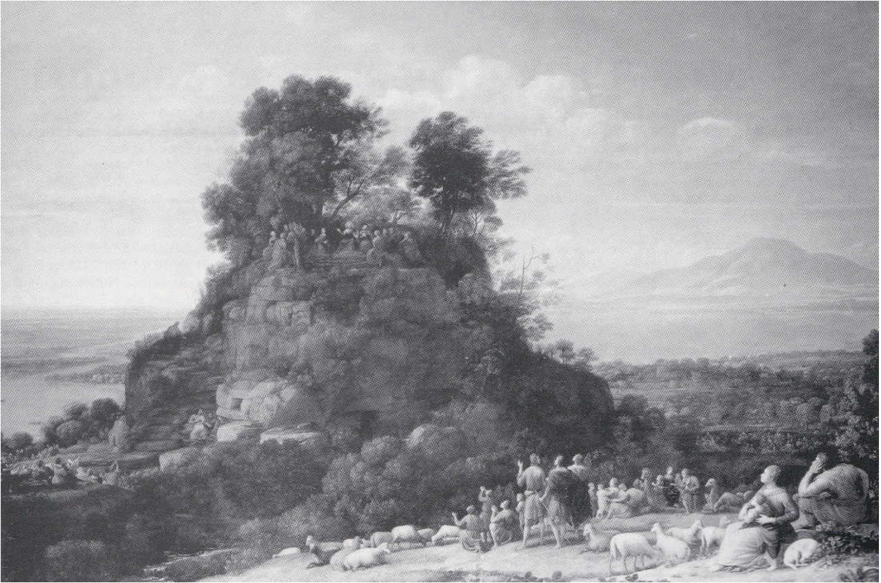
Fig. 8. - Claude Lorrain, Le sermon sur la montagne , Frick Collection, New York.