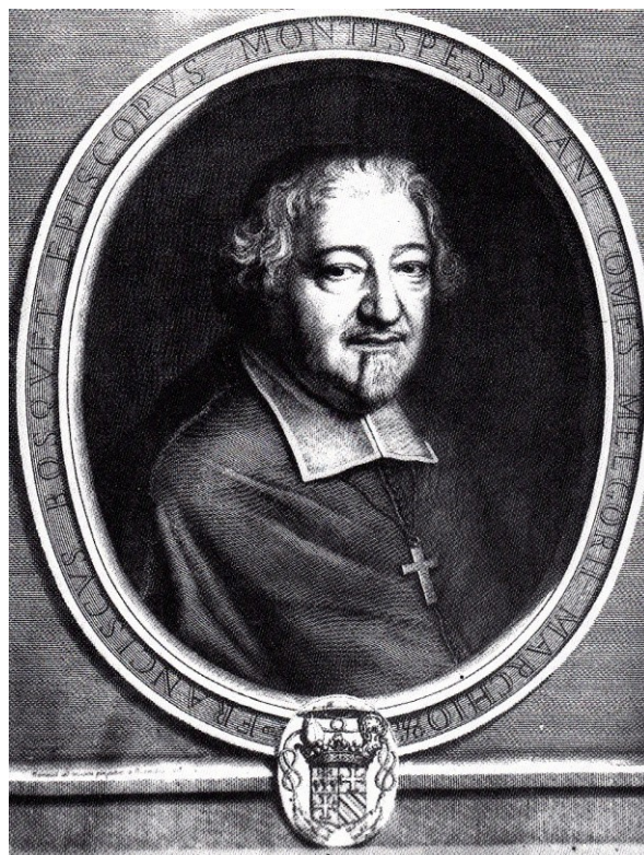
Fig. 7. - François Bosquet, C.D.R.P. Languedoc-Roussillon, Montpellier

L'accession, en 1656, de François Bosquet (1605-1676) (fig. 7) au siège épiscopal ouvrit une période importante de la vie artistique montpelliéraine, au sein de laquelle le rôle de l'Église était prépondérant, depuis la reprise en main de la ville par le pouvoir royal en 1622. Ce protégé du chancelier Sèguier, depuis 1648 évêque de Lodève, résidait en 1654 à Rome où il avait commandé à Claude Lorrain deux tableaux sur des thèmes religieux : Le Sermon sur la montagne , conservé aujourd'hui à la Frick Collection à New York, et Esther entrant dans le palais d'Assuérus dont il n'existe plus, à la suite d'un incendie, qu'un fragment de l'extrémité gauche, chez le comte de Leicester à Holkham Hall (fig. 8 et 9). Ces deux tableaux suivirent sans doute Bosquet à Montpellier. Probablement stimulé par le nouvel évêque, le chapitre, afin de décorer le maître-autel de la cathédrale Saint-Pierre, se décida, en février 1657, à passer commande à Sébastien Bourdon (1616-1671), d'un grand tableau d'autel. La chute de Simon le magicien , œuvre à laquelle le célèbre artiste, originaire de Montpellier travaillait depuis au