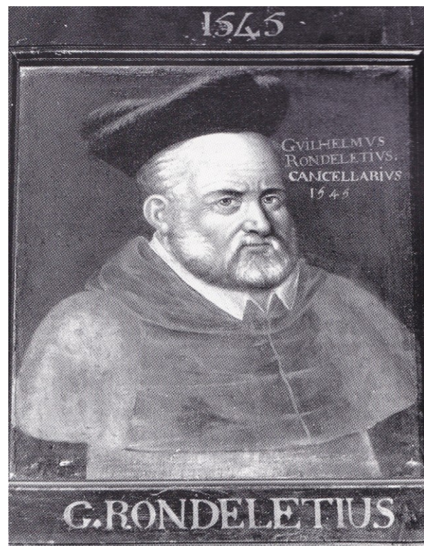
Fig. 6. - Guillaume Rondelet, Faculté de Médecine, Montpellier.