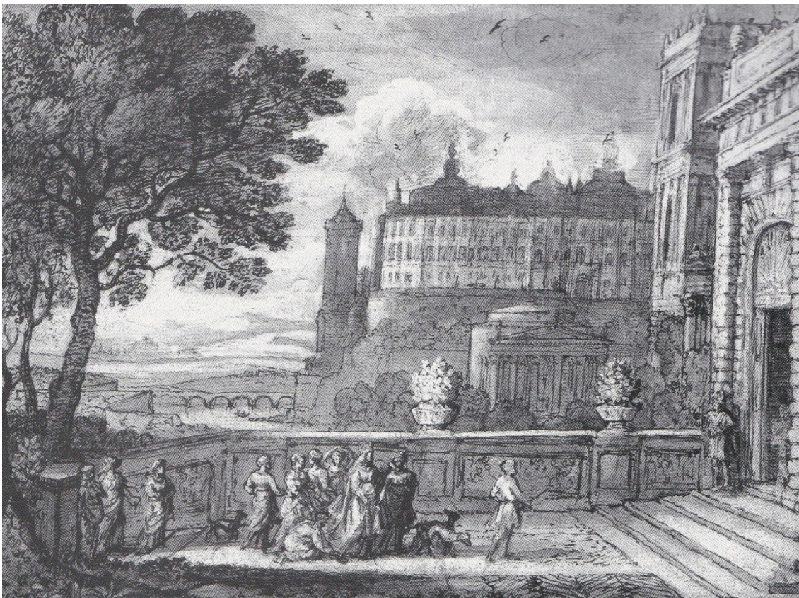
Fig. 9. - Claude Lorrain, Esther entrant dans le palais d'Assuérus (dessin du Liber Veritas), British Museum, Londres.