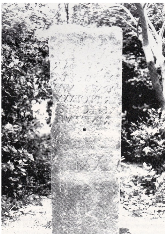
Fig. 4. - Borne milliaire de la Via Domitia, Château de Teillan, Aimargues.