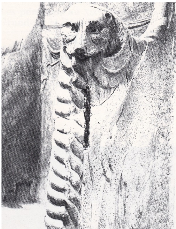
Fig. 2. – « Chaire de préteur » (détail), Faculté de Médecine, Montpellier.