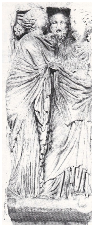
Fig. 3. - Fragment de sarcophage antique, Faculté de Médecine, Montpellier.