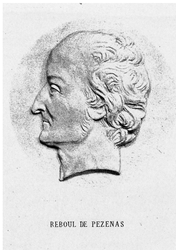
Médaille. Photographie ancienne