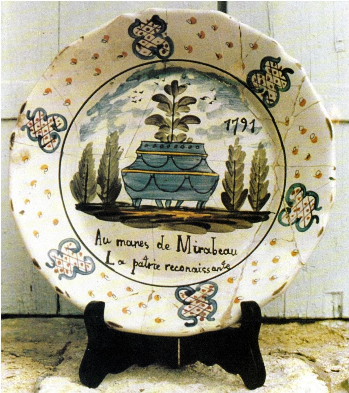
Aux mânes de Mirabeau la Patrie reconnaissante. Assiette décorée, Musée de Marsillargues, Hérault.