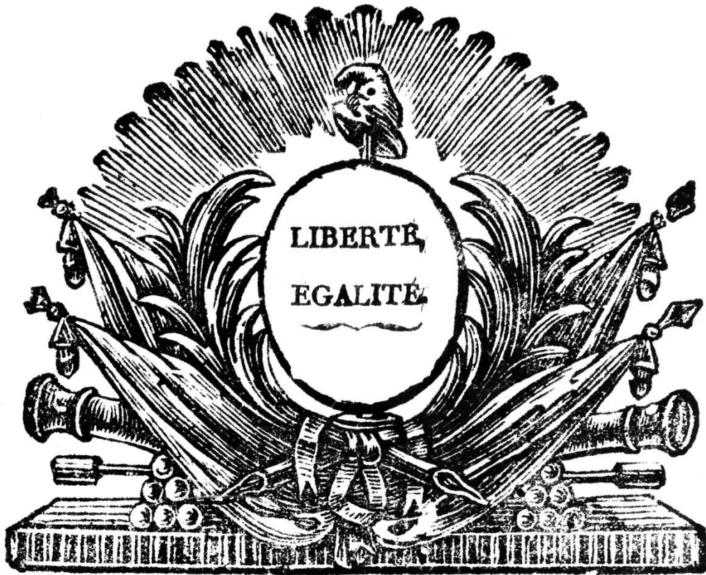
L 5982 An 2