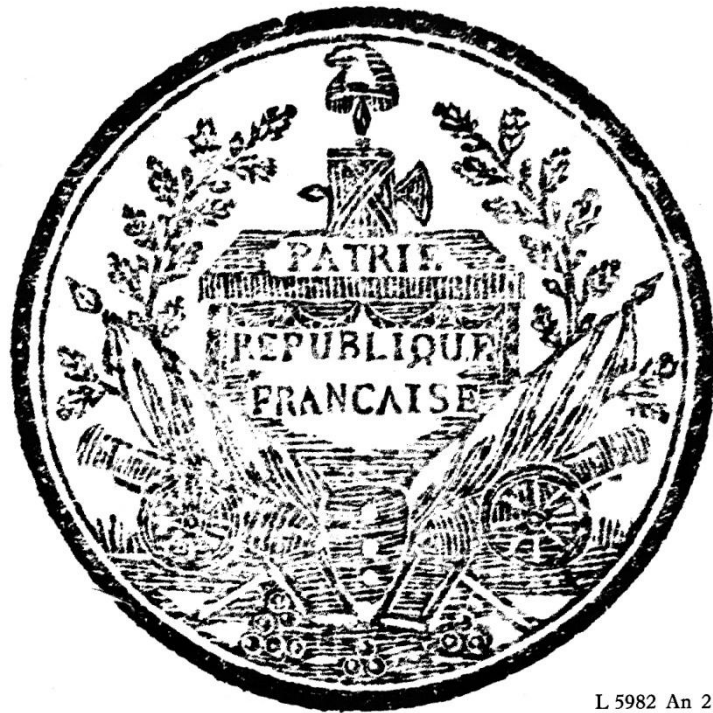
L 5982 An 2