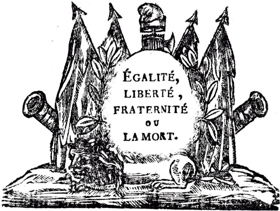
L 5983 An 2