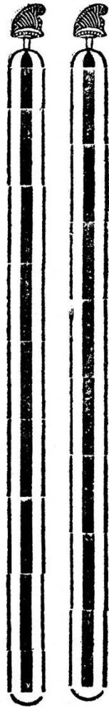
L 5984 An 4