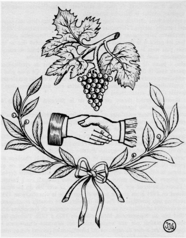
Motif central du drapeau du syndicat professionnel des ouvriers agricoles et terrassiers de Sérignan (dessiné par Joachim Juanola).

Ce motif exprime une symbolique simple, accessible à tous : le pays viticole (la grappe de raisins), la force que donne l'union dans le syndicalisme (mains jointes de l'employé à gauche et de l'ouvrier à droite), les intentions pacifiques affichées des syndiqués (double rameau d'olivier). Situation exceptionnelle en France, du début du siècle aux années 1950, les syndicats d'ouvriers agricoles de l'Hérault et même du Languedoc l'emportent nettement en dynamisme sur les organisations syndicales urbaines.