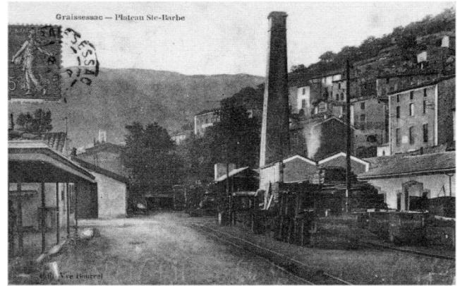
Au cœur du pays minier de l'Hérault : Graissessac.

Les mines de houille de l'Hérault s'étendent au nord-ouest du département sur une vingtaine de kilomètres et une douzaine de communes sont directement intéressées par l'exploitation minière. Le syndicalisme ouvrier s'y organise dès les années 1890. Durant l'entre-deux-guerres et jusqu'à la réunification syndicale de 1935-1936, les mineurs se partagent entre la confédération générale du travail, majoritaire mais pratiquant surtout un syndicalisme de présence, et la confédération générale du travail unitaire plus active lors des conflits sociaux.