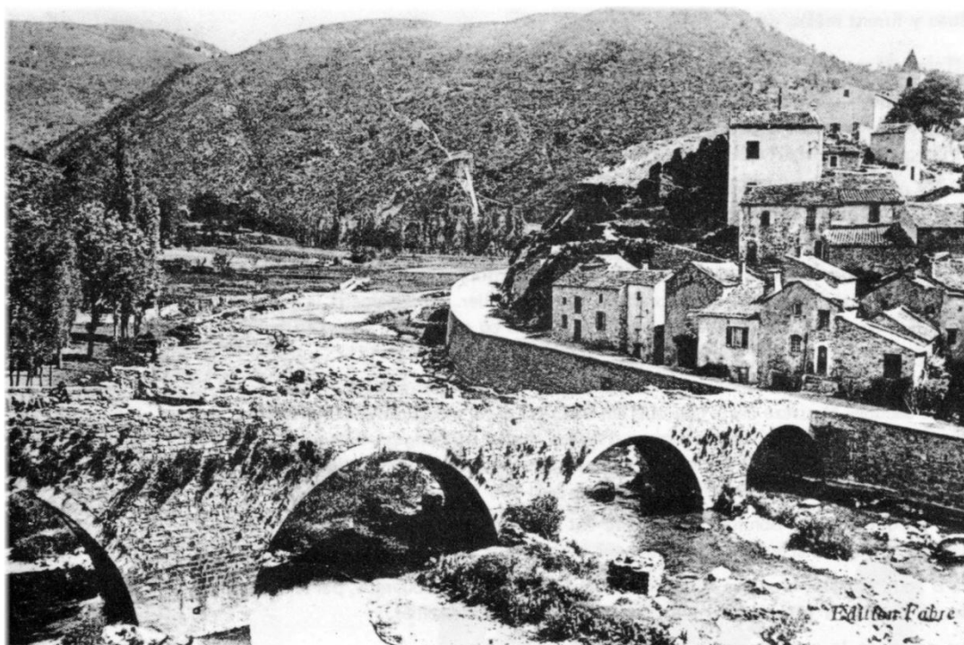
Avène. Le vieux pont sur l'Orb (Vue prise au début du siècle).

On peut y lire « Les habitants déclarent se trouver hors de payer la taille et la capitation (54). Si S. M. n'a la charité d'arrêter la fureur de ce seigneur qui emploie une grande santé, dont il jouit sans aucune incommodité et les grands revenus qu'il reçoit de la libéralité du roi, à entretenir une grande troupe, des huissiers et sergents auxquels il fait faire des courses nuit et jour par toute sa terre pour emprisonner ceux qui refusent de lui donner leurs biens... Les terres sont incultes depuis sept ans qu'il est seigneur d'Avène. Il n'est pas occupé d'autre chose que de forcer les habitants à lui relâcher leurs biens et, par la force et la violence, il les contraint à lui faire des contrats de vente et de relâchement il prend les biens de la veuve et de l'orphelin et, lorsque quelqu'un refuse, il fait des procédures injustes... Il n'épargne pas les malades qu'il fait mourir en prison. Si quelqu'un est appelé en justice pour témoigner contre lui, il te fait conduire dans son château et le fait mourir sous le bâton... Ce seigneur n'épargne pas même la religion et met tout en usage pour vexer et éloigner les curés afin que les habitants se retrouvent sans consolation et sans secours. Pour intimider les curés des cinq paroisses dont la communauté est composée, il fait craindre que son neveu sera évêque de Béziers. » (55)