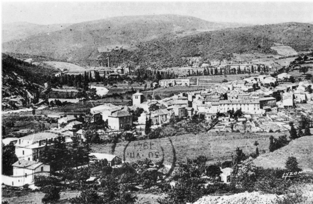
Ceilhes. Le village et la plaine de Bouloc. (Vue prise vers 1920).

C'est ainsi qu'il bénéficie de rentes et d'héritages de la part de personnes étrangères à sa famille, soit de Ceilhes, soit d'ailleurs (45). Par ailleurs, il multiplie les acquisitions de terres au voisinage du domaine de Bouloc. Il fit de même à Avène, spécialement au tènement de « la Loupie » (46). Le cas échéant, il n'hésitait pas à user de la contrainte envers les vendeurs, ainsi que nous le verrons plus loin (47).