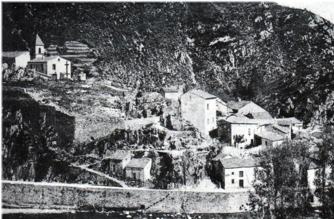
Avène. (Vue prise au début du siècle).

L'évêque de Lodève, Jacques-Antoine Phélypeaux était mort le 15 avril. Malgré sa conduite privée scandaleuse, ses relations étaient restées bonnes avec les Fleury, comme avec les Rosset-de-Rocozels, notamment avec l'abbé Henri qui avait d'ailleurs présidé ses obsèques le 19 avril (62).