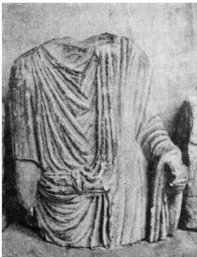
Fig. 5 - un togatus biterrois, en grande toge. Musée lapidaire cloître de la Cathédrale Saint Nazaire.