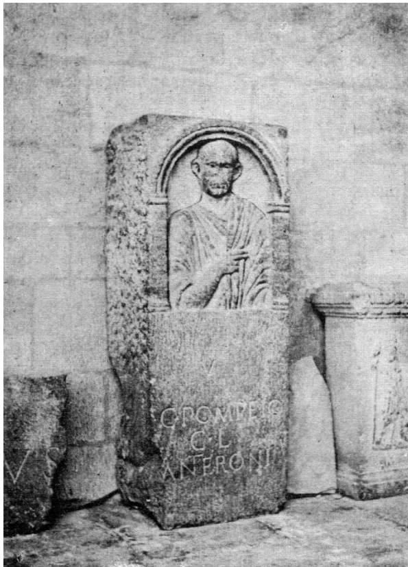
Fig. 3- Stèle de C. Pompeius Anteros (musée lapidaire de Béziers, cloître de la Cathédrale Saint Nazaire)

Remarquer avec le geste de la main droite sur le trait incisé sur le bord du relief.