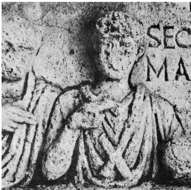
Fig. 4 - Stèle de Marennes : détail