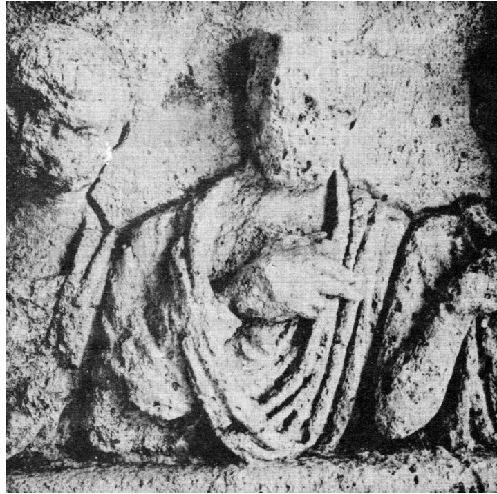
2 - Stèle de Marennes : détail.