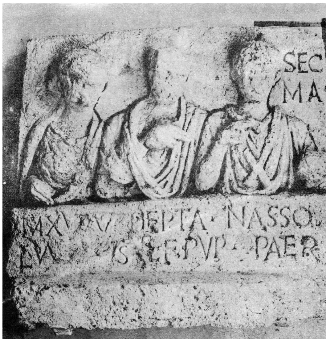
Fig. 1- La stèle de Marennes.